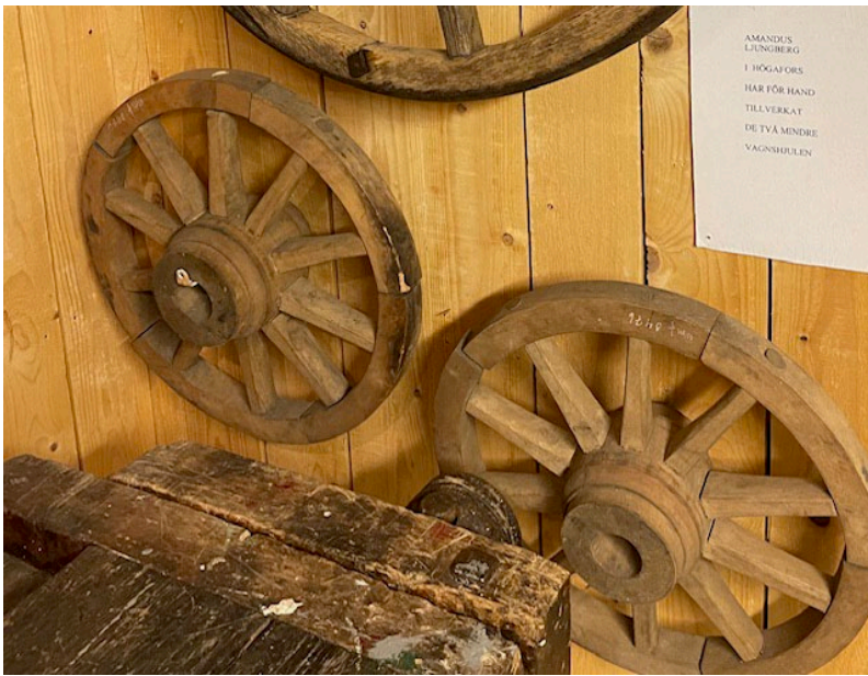
Vagnshjul från Kvarnabergs hjulfabrik hänger i nischen om snickeri- och möbelfabriker.