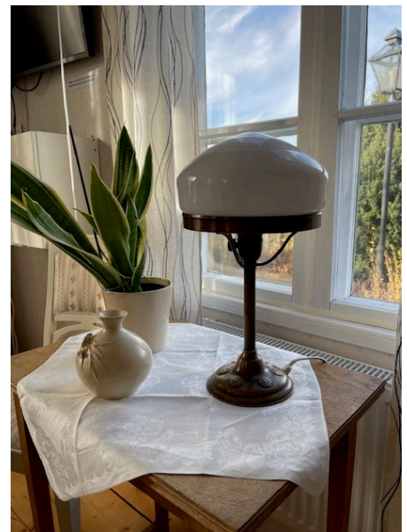
"Gustav Bagares" lampa i salen.