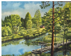
Byarums Hembygdsförening Årsskrift 2024

Årets bok har 16 artiklar, och innehållet är väl fördelat mellan Byarums landsbygd och tätorterna. Byarums hembygdsbok kommer att spridas genom roteombud men går också att köpa på ICA, Acleja, Preem och i Magnisa stuga. Pris 150 kr.