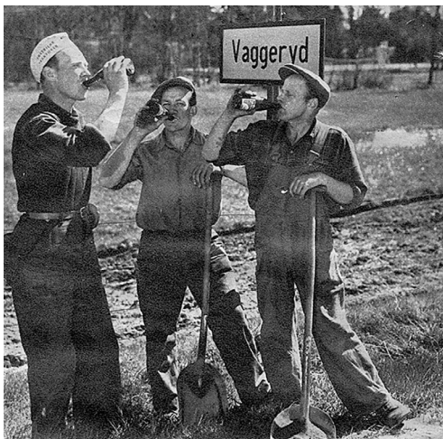
Den stora pilsnerstriden i Vaggeryd

Utgiven av hembygdsföreningarna i Bondstorp, Svenarum, Tofteryd-Hagshult och Åker