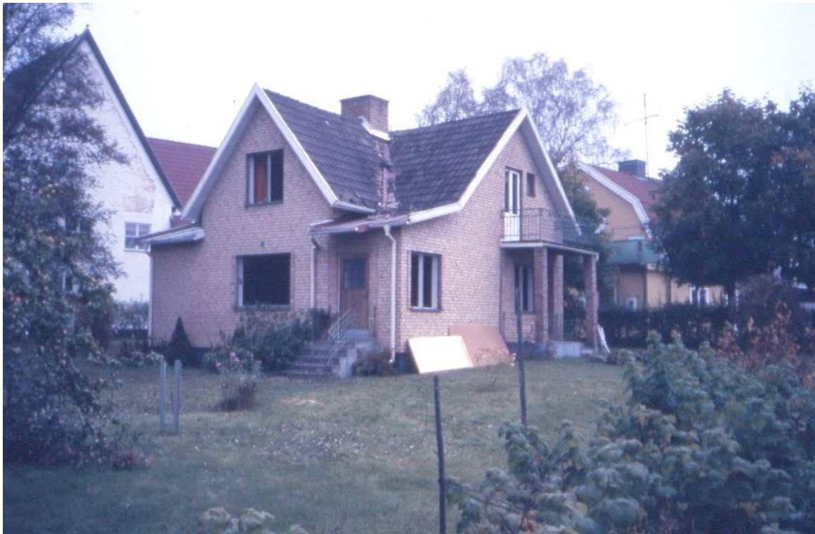
Närmast ses huset Skuggan med adressen Kapellgatan 6, till vänster Missionskyrkan. Det gula huset är Missionskyrkans pastorsbostad, som från början hette Betlehem. omkring 1990 innan huset revs.