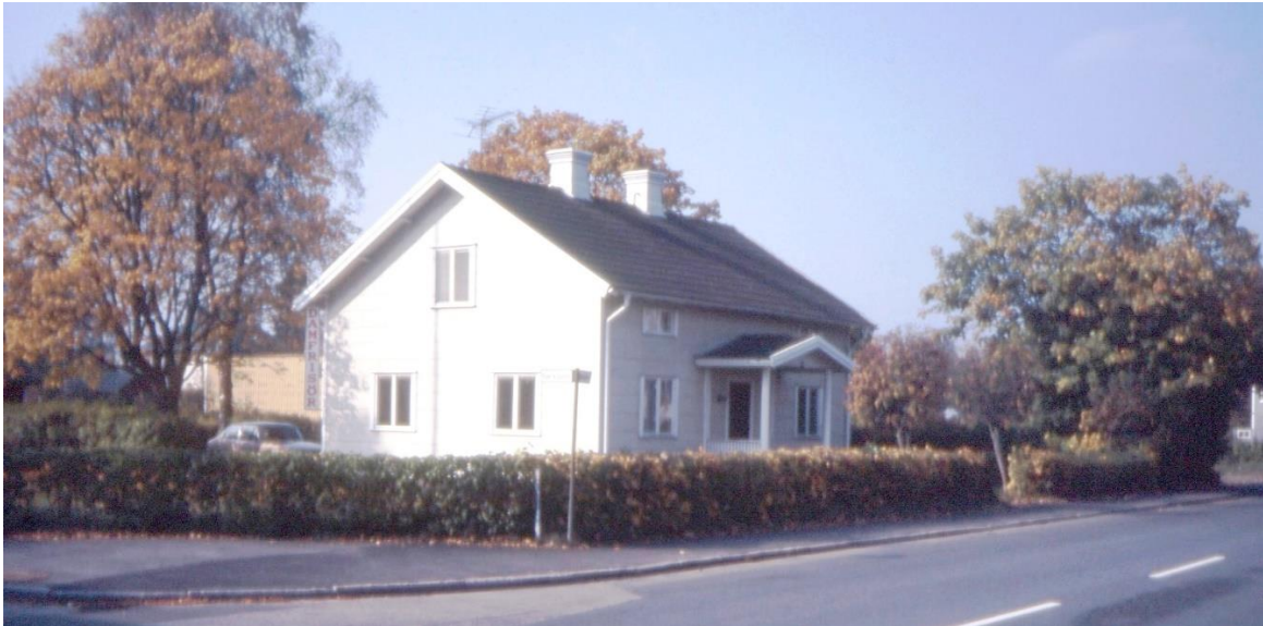
Dalskog, Storgatan 22. Foto från 1980-talet innan huset revs.