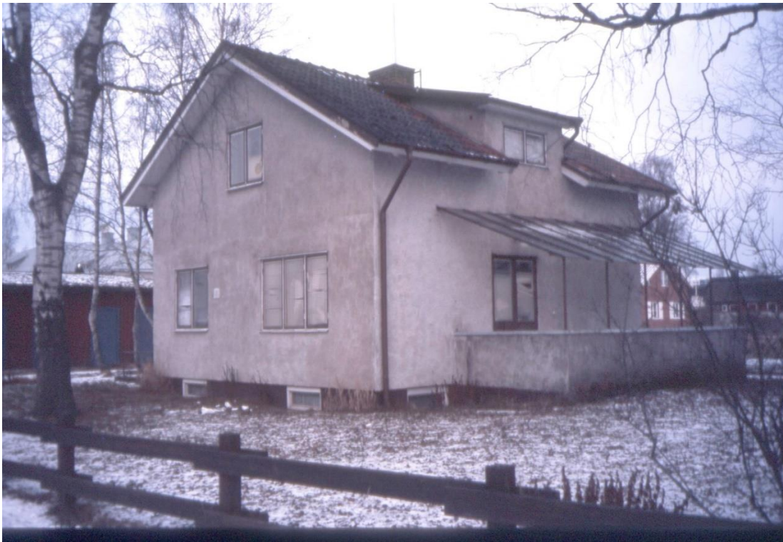
Fridhem 2 strax innan huset revs på 1990-talet. Senaste adress var Bagarens väg 5.