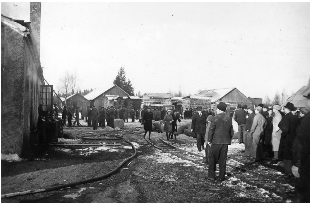
Foto från branden 1946. I bakgrunden ses brädstaplarna som fanns kvar ända till Sporthallen byggdes. Betelkyrkan till höger.