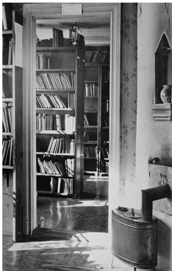
Interiörbild från biblioteket som fanns i Skänkelund.