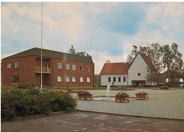
Östra torget med kommunalkontor, tidigt 1970-tal.