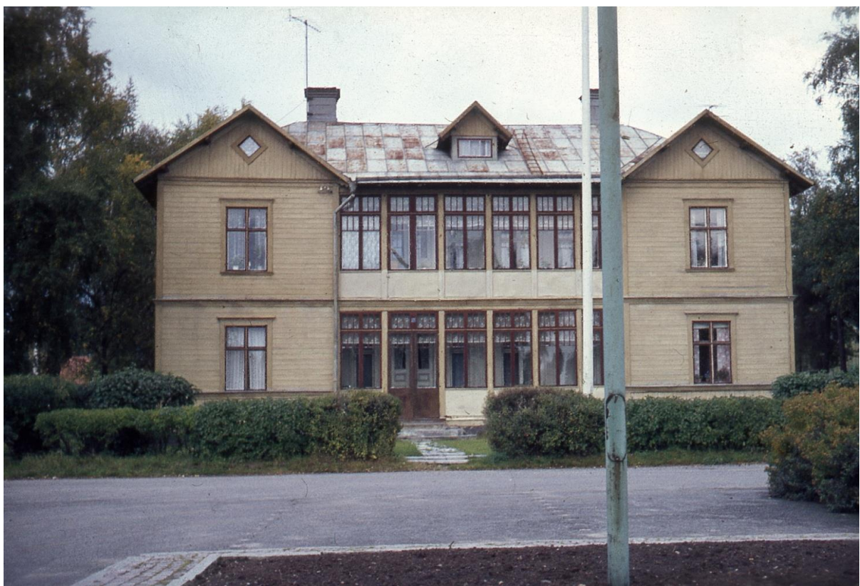
Annelund 1970.