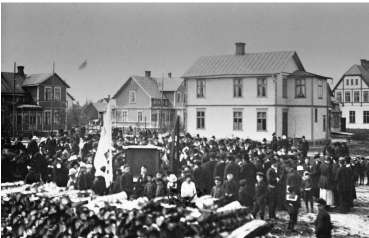
Freds demonstration på Östra torget medan första världskriget pågick. Foto från 1917.

De första tjugo åren av 1900-talet lär det ha sparkats en hel del fotboll på torget och 1911 skulle Hjalmar Branting tala där. Men den gången var det så varmt så det politiska mötet fick flytta ut i skogen. Torget fortsatte under resten av 1900-talet att användas till politiska möten, bland andra har Olof Palme varit där och talat. Olika typer av demonstrationer har ägt rum på platsen och ibland har den använts till frikyrkliga tältmöten. Julen brukade också dansas ut där.