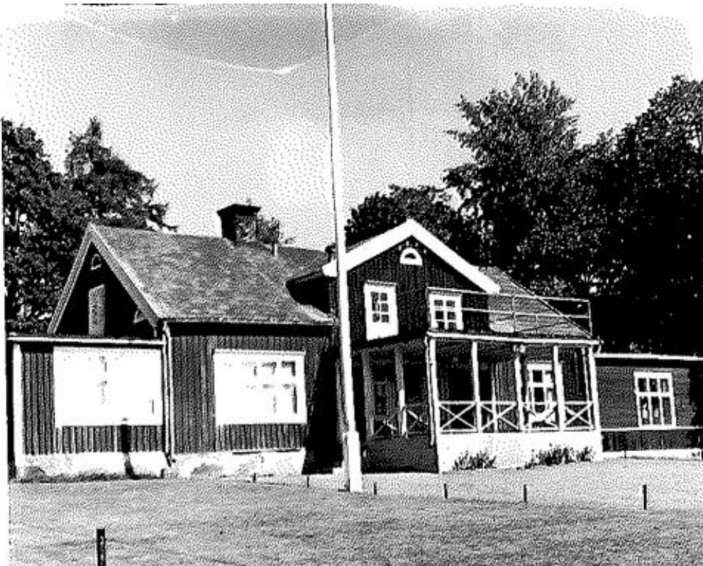
Länsmansgården var länsmannens tjänstebostad. Den revs 1978 för att lämna plats åt den nya vårdcentralen.

Löneförmånen från början utgjordes av ett omfattande landområde, som kunde brukas av länsmannen (eller arrenderas ut av denne). Härtill kom att länsmannen/landsfiskalen var befolkningen behjälplig – mot skälig ersättning – med diverse pappersexercis, anmä- lan till handelsregistret, ansökan om konkurs, köpekontrakt etc. I de fall han (för det var alltid en man) agerade som åklagare vid häradsrätten och böter utdömdes som straff tillföll en del av dessa böter honom.