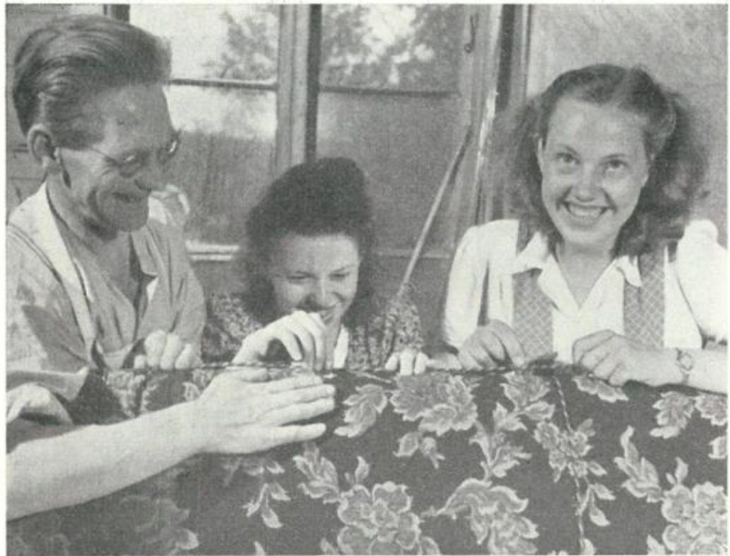
Tapetserare och dito sömmerskor visar inga sura miner

I fortsättningen får vi följa företagets med- och motgångar, bl.a. under depressionen på 1920-talet. Här redovisas att en av de mer gångbara modellerna, som Strömbergs företag introducerade, var ottomanen "Smålänningen". 1928 utvidgades rörelsen med en tapetserarverkstad och samtidigt utökades tillverkningen att omfatta fåtöljer och moderna sittgrupper. En ny kristid inträffade på 30-talet, men denna utnyttjades till en utökning av fabriken. Denna möjliggjordes genom att arbetare vid företaget deltog i utbyggnaden. Golvytan uppgick 1938 till ca 3 000 m 2 och arbetsstyrkan till ett 50-tal.