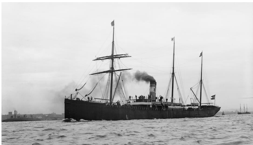
Foto av ångaren Norge.