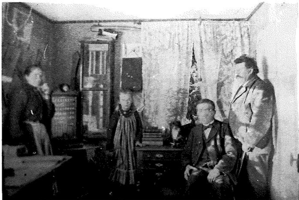
Äldsta fotografiet från Virserums telefonstation inrymt i "Lill-Karis stuga" innan det nya huset uppfördes.

Efraim köpte stugan 1890 av Isak och "Lillkari" (som hon brukade kallas). Isak tjänade sitt bröd med att göra riskvastar och Karin sopade skolgolven med dessa så dammet yrde; hon var ju skolstäderska. Samma år byggde morbror till två rum och kök på östra sidan av stugan Isak och Karin skulle ha ett rum i stugan så länge de levde.