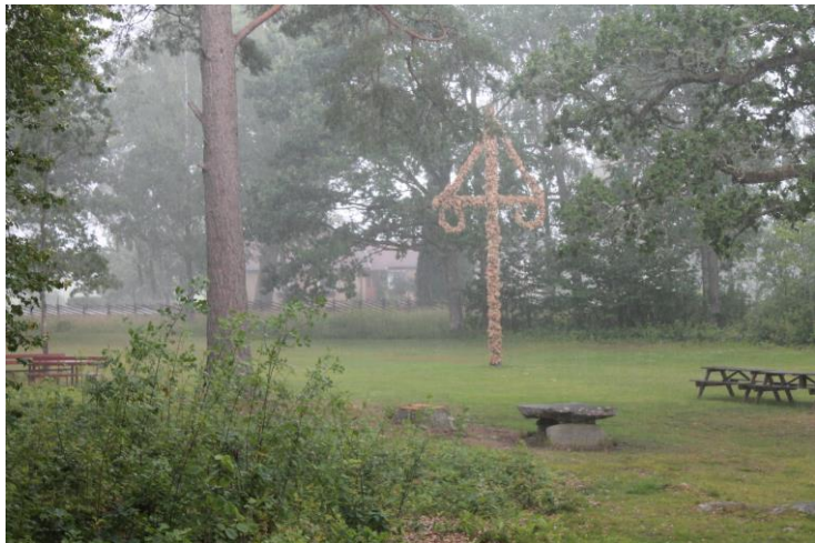
...och så här såg det ut 5 minuter efter öppning.