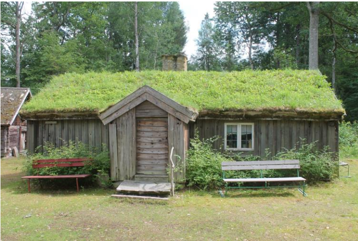
Så här fint var det 5 minuter innan öppning...