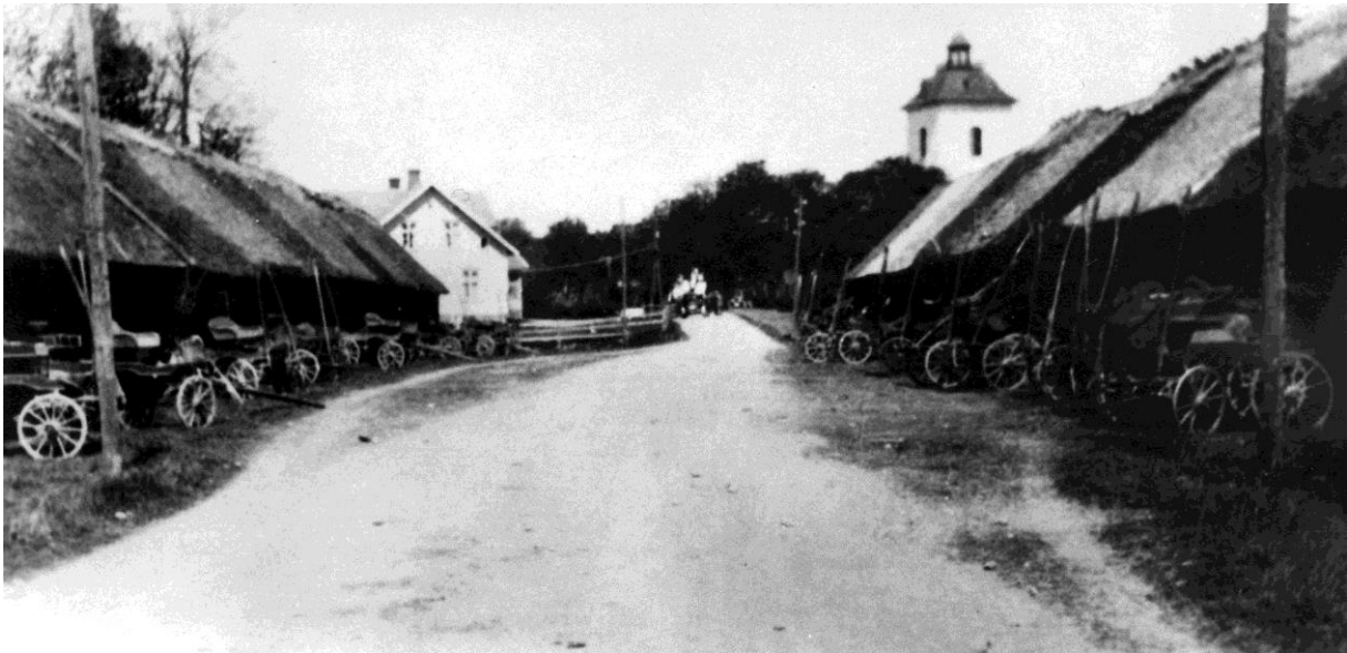
Bild på kyrkstallen från Hembygdsföreningens bildarkiv, tagen omkring 1912.

Efter hand som bilen gjorde sitt inträde avvecklades både pusteställen och kyrkstallar, de senare revs ofta runt 1950-talet.