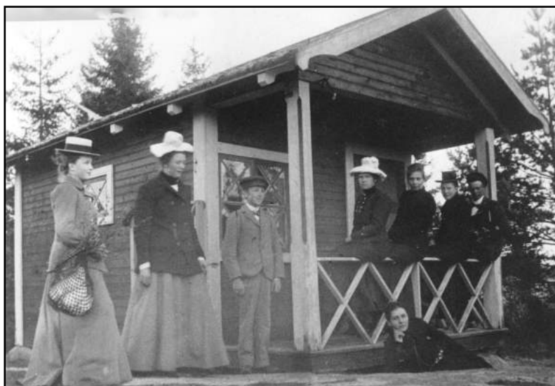
I närheten av dansbanan fanns Skyttepaviljongen Bankebergs skjutbana, norr om gården Solmark. Foto omkring år 1902.