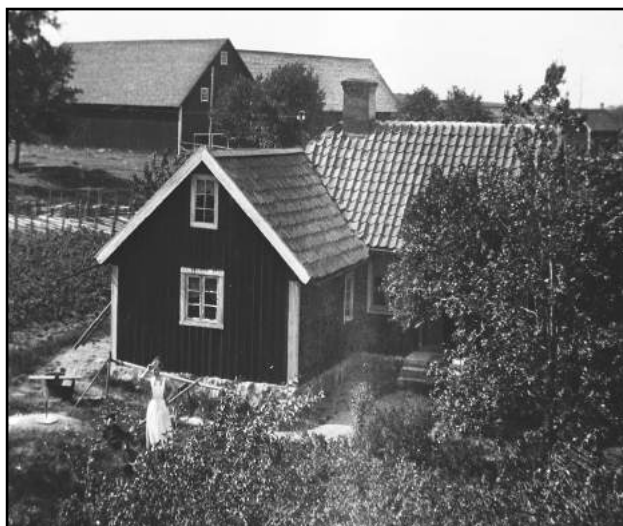
Gustad Lunden någon gång på 1920-talet. I bakgrunden syns Norrgårdens ladugård.