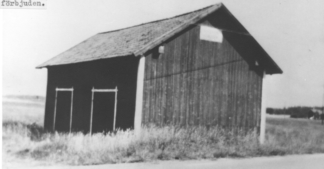
Kreatursvågen Bank. Mellang. Vikingstad. Kortet taget omkr. 1960. På skylt.affisk. förbjuden.

I nästa nummer av Hembygdsbladet fortsätter vi vår promenad.