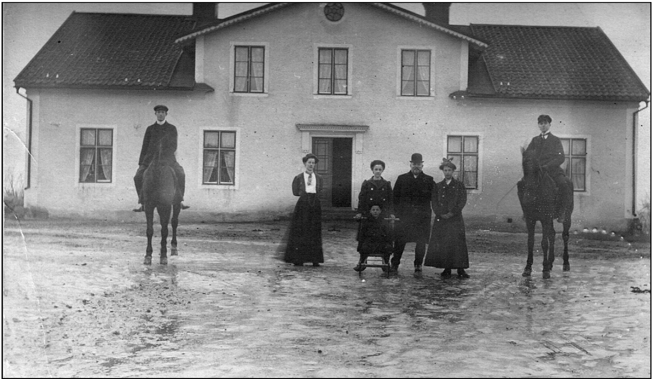
Gästgivaregården som byggdes 1845. Vykort stämplat 1910.

En renovering utfördes på 1870-talet. Gästgivaregården bestod av 11 byggningar bland andra två flyglar. Den östra innehöll bank och speceriaffär (fram till 1888) samt televäxel, i den andra västra flygeln fanns en "Win & Sprithandel" kallad Brännvinsboden Stenfoten. Huruvida namnet Stenfoten var officiellt eller ej är obekant. Namnet stämmer ju väldigt bra in på var brännvinsboden var belägen, nämligen i flygelns stenfot. Ovanför dörren står att läsa "Win & Sprithandel".