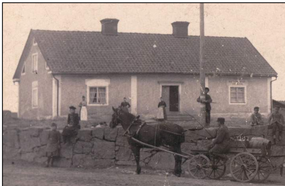
Sparkassan till höger i Gästgivargårdens östra flygel.