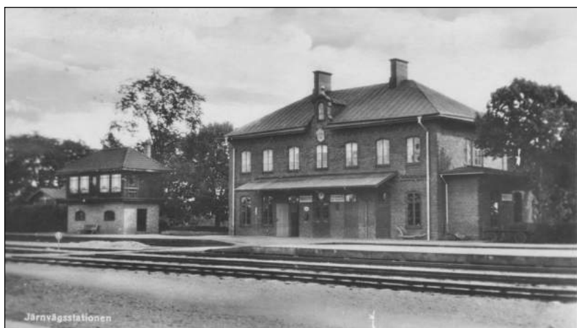
Bankebergs station före 1926.