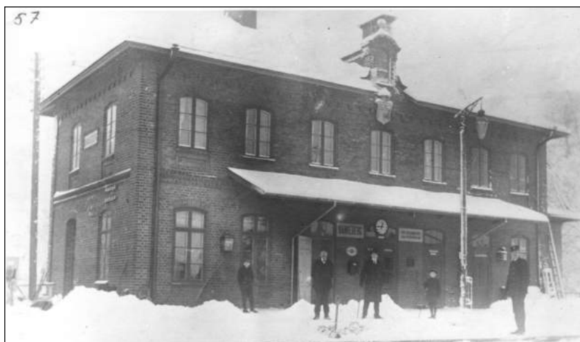
Bankebergs järnvägsstation. Troligen år 1915.

En omfattande godstrafik har alltid förekommit här, ex år 1875 så lastades det ut 1051 oxar. De kom främst från trakterna kring Sjögestad. 890 svin och 77 får lastades av här då. Många tunnor brännvin samt spannmål med mera lastades här. Rakereds tegelbruk 1897-1934, hade en tegellada på bangården där tegel lastades ut ända till 1940. På senare år var det en omfattande hantering av olika slags lantbruksmaskiner. Flera spannmålsmagasin har funnits i anslutning till spårområdet. De sista revs 1997.