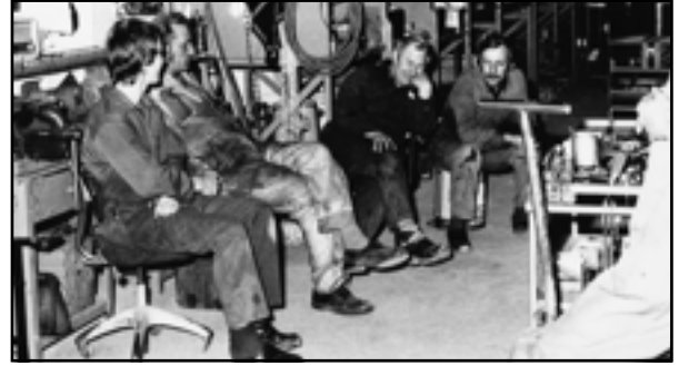
Bild av nya Sparmanfabriken som stod färdig år 1978, samt några av de anställda.

Dessa produkter blev inledningen till ett långt samarbete med Alfa-Laval, som skött marknadsföringen av vagnarna. Under hela 1960-70 talen var vi i ständigt behov av mera utrymmen för tillverkningen. Vi byggde till och ändrade om och vi köpte en verkstad som ligger på SJ:s banområde i höjd med idrottsanläggningen.