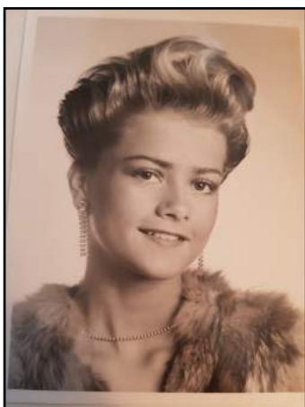
Till vänster: Frisyrmodell