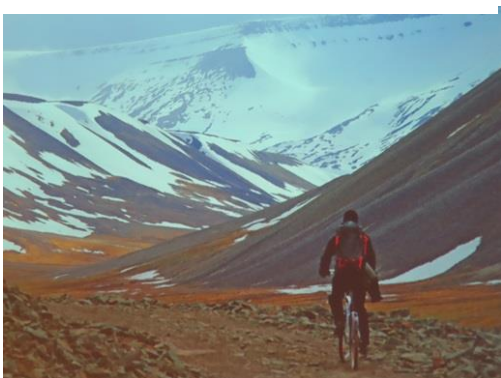
På cykel på Svalbard 1