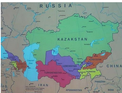
Turkmenistan och dess grannar 1