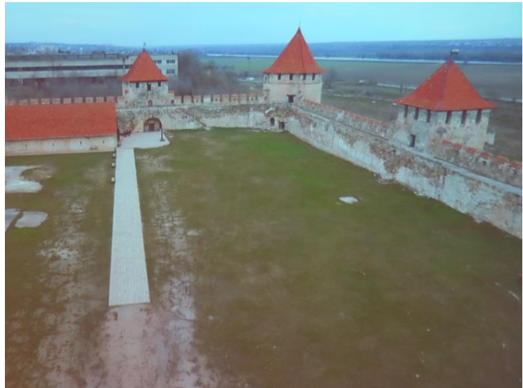
Fortet i Bender 1