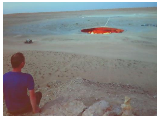
Sedan 1971 brinnande naturgas 1