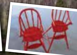
Vi lackar inte bara bilar