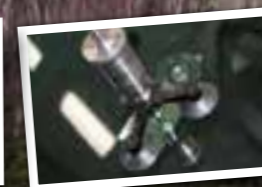
Biiglas och stenskottlagning