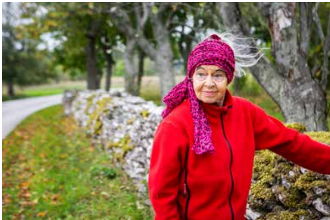
"MÅNSKUGGA", Towan Obradors NYA BOK om Alma Sigridsdotters hemliga mor:

Sigrid grät tyst. Ännu blödde hon då och då. Stapplade fram. Blusen våt av bröstmjölk. Febrig. Förvirrad. Bar barnet i rosa finsjalen. Sen kväll hade zigenargruppen rivit sitt enkla sommarläger utanför Klintehamn och var nu på väg mot Visby stad och båten till fastlandet ...."