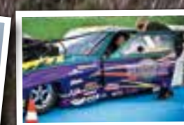
Bedriver internationell dragracing