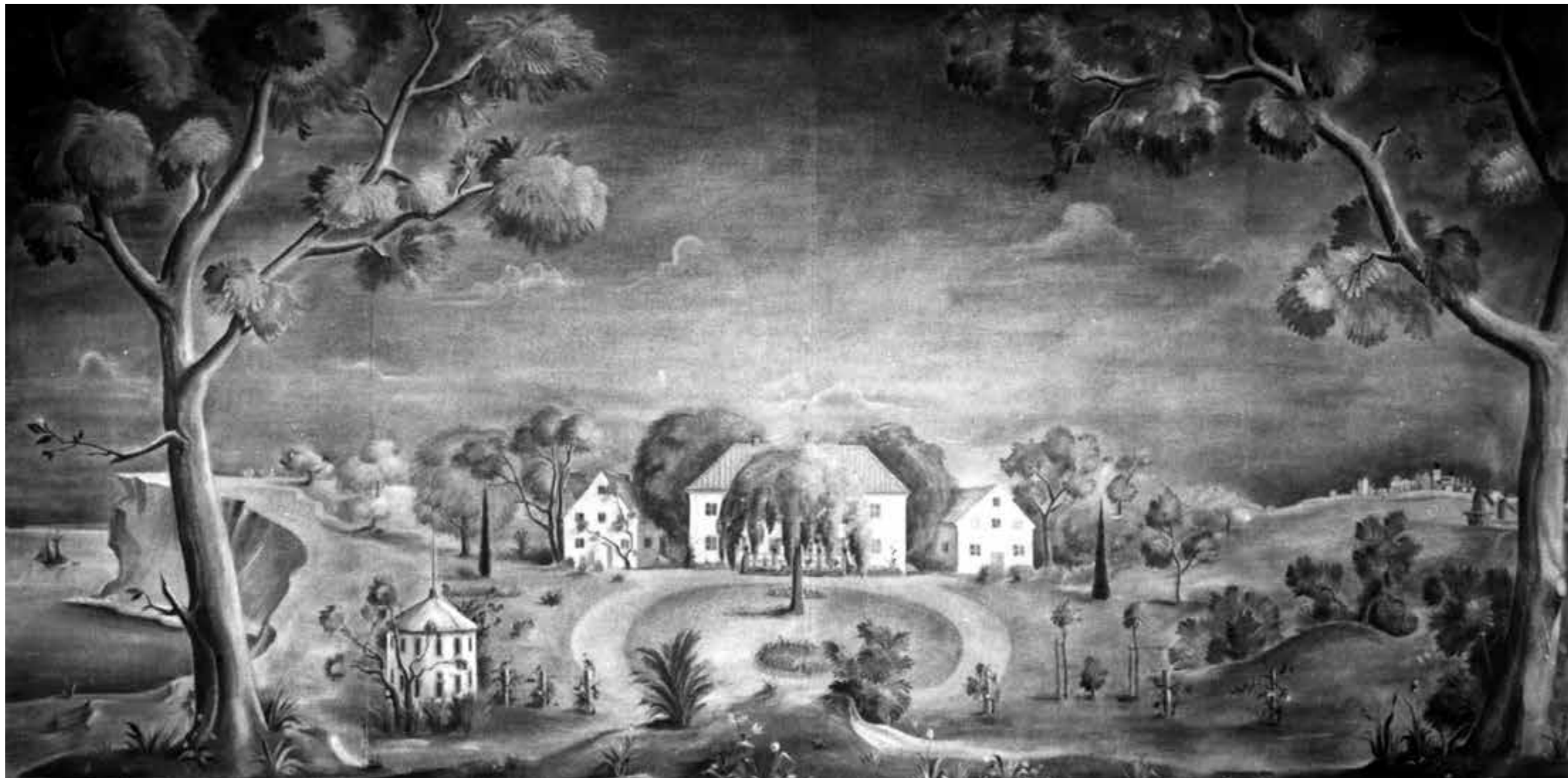
"Väggmålning av Nygårds i gamla Gotlandsbankens hus vid S:t Hans plan i Visby".