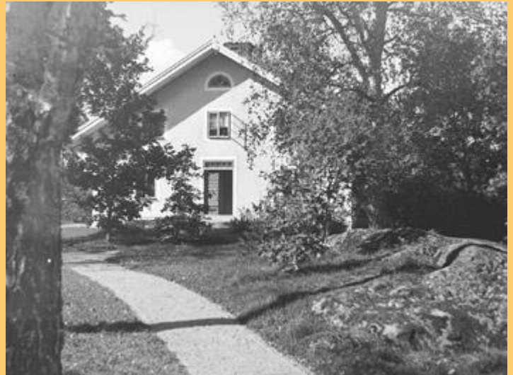
Stenby Mölnbo, bilden är från 1930-talet

Ett år gick det scharlakansfeber i socknen, vi var sjuka alla utom far och mor, jag var nog mest illa därän, mor sa att jag yrade på nätterna. Som men efter den sjukdomen fick jag nedsatt syn på vänster öga, jag märkte det ej förrän jag mönstrade. Under konvalescensen släppte all hud på kroppen och man fick bada i någon mörk lösning i varmt vatten. Far ringde doktorn i Gnesta så vi fick medicin, närmaste telefon fanns vid rättarbostaden i Stenby, de vågade ej släppa in far utan han stod utanför ett fönster och bad dem ringa, vi hade fri läkarvård från Hjortsberga gård.