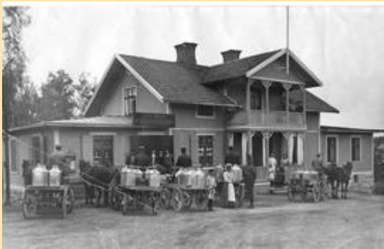
Bild från Mölnbo , Klas Jonssons affär i början av 1900 talet, fotograf okänd.