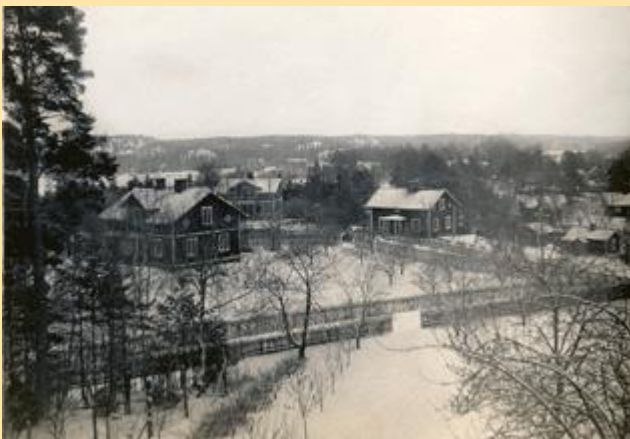
Bild över Mölnbo , tagen från Alphyddan troligen på 1920-talet

Ett år gick det scharlakansfeber i socknen, vi var sjuka alla utom far och mor, jag var nog mest illa därän, mor sa att jag yrade på nätterna. Som men efter den sjukdomen fick jag nedsatt syn på vänster öga, jag märkte det ej förrän jag mönstrade. Under konvalescensen släppte all hud på kroppen och man fick bada i någon mörk lösning i varmt vatten. Far ringde doktorn i Gnesta så vi fick medicin, närmaste telefon fanns vid rättarbostaden i Stenby, de vågade ej släppa in far utan han stod utanför ett fönster och bad dem ringa, vi hade fri läkarvård från Hjortsberga gård.