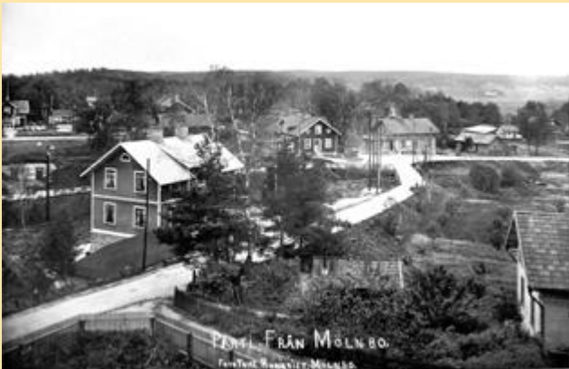
Bild över Mölnbo tagen från Rosenborg "kondis" fotograf, Ture Runqvist. Året är okänt för mig.