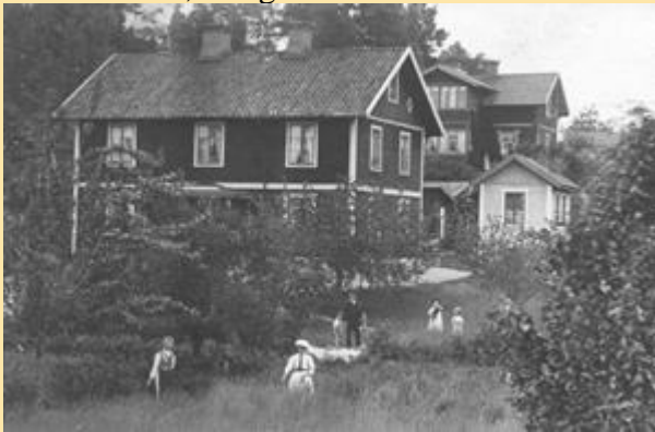
Bild från Mölnbo , Haga i förgrunden, huset bakom heter Viby, årtal och fotograf okända.