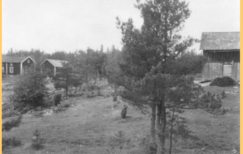
Torpet Rösjön med uthus, 1924

Skolsmörgåsarna bestod av grovt smaklöst bröd med ett tunt lager margarin på. Händes det någon gång att brödet tog slut kunde jag få en