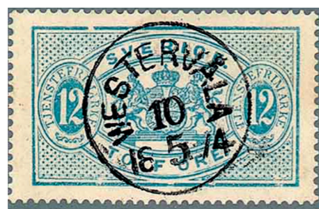
Praktexemplar av en ovanlig stämpel

Hur post befordrades till och från Ängelsberg/Västervåla före frimärkenas införande skall inte avhandlas här, bland annat för att det är svårt att få tag i material. Strömsholms kanal bör haft en del att göra med hanteringen. Den läsare som kan tipsa redaktionen är välkommen.