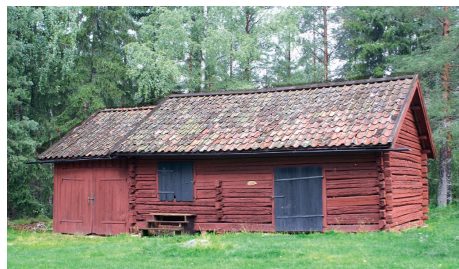
Skraphagslogen flyttades från Sörby till hembygdsgården 1971. Den är från 1700-talet, men tillbyggnaden till vänster är nyare. Där förvarades stockbåten under flera år.

På årsmötet 1979 fick styrelsen i uppdrag att skaffa ytterligare en byggnad till förvaring av alla bänkar. Ett gammalt tornur hittades i en bod på Kaplansgården och togs senare om hand. År 1974 meddelades att föreningen erhållit en tröskvandring från Djupnäs. Det beslöts att forsla den till hembygdsgården och sätta upp den bakom logen.