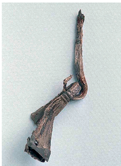
Rembeslaget som fanns i graven. Finns digitaliserad. Sök i samlingarna på "Västervåla".