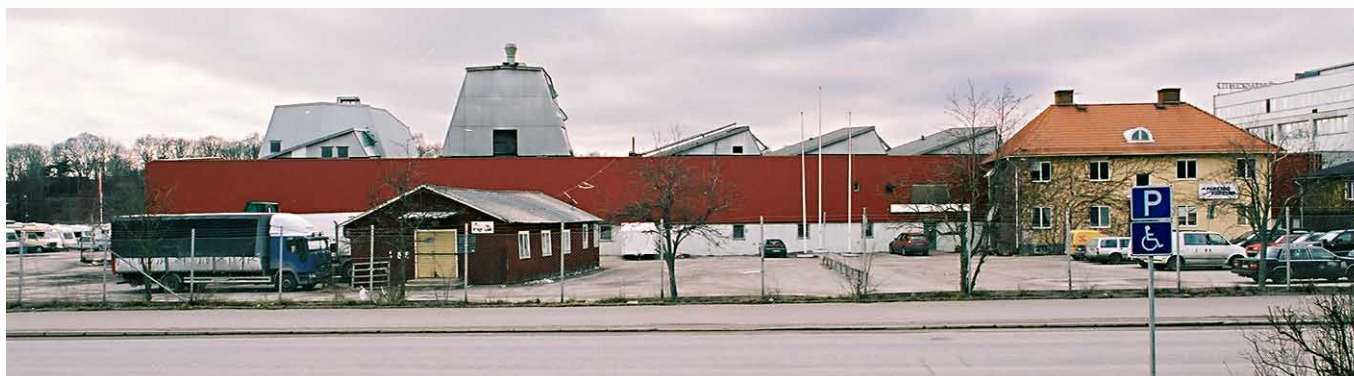
Östfasaden på industrihallen för plastprodukter från 1961. Till höger huvudbyggnaden till det tidigare trädgårdsmästeriet, ursprungligen byggt 1908 (?), ombyggt på 1930- och 1950-talen.