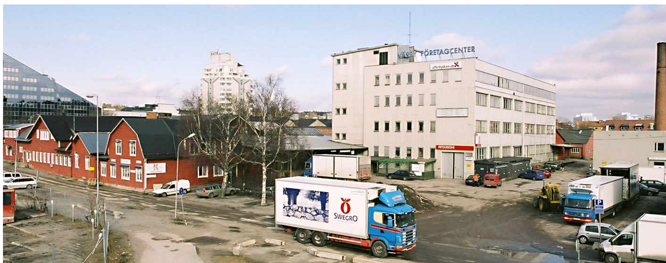
Översiktsbild från väster över de äldsta byggnaderna från 1903-1917 och byggnaderna från 1960 resp 1951.