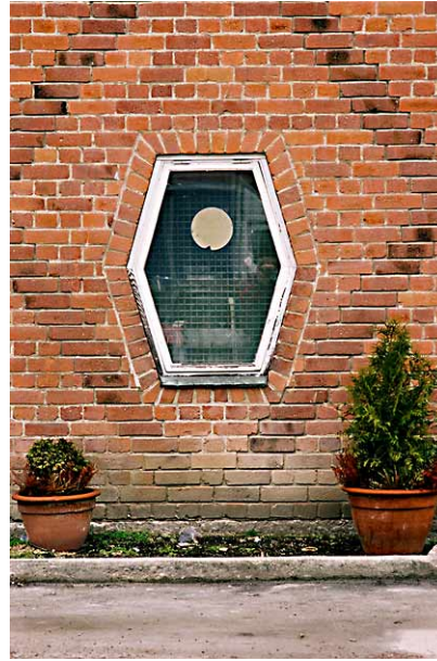
Fönster och mönstermurning på östfasaden på industrihallen för pressgjuteri från 1948.