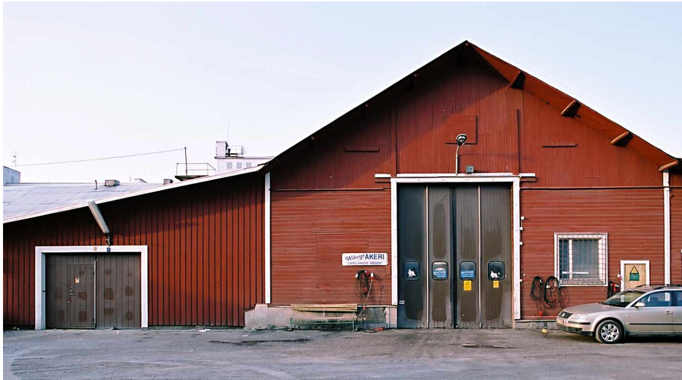
Den äldsta byggnaderna från 1903 för det ursprungliga tubdrageriet, senare tillkomna portar.