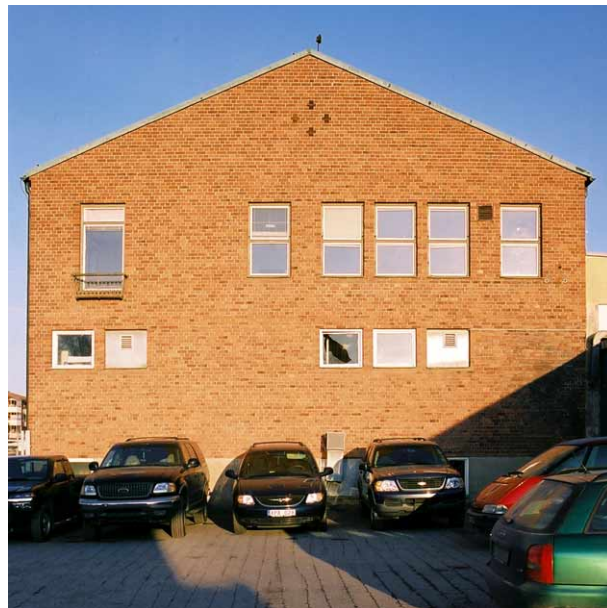
Västgaveln på kontorsbyggnaden från 1948.