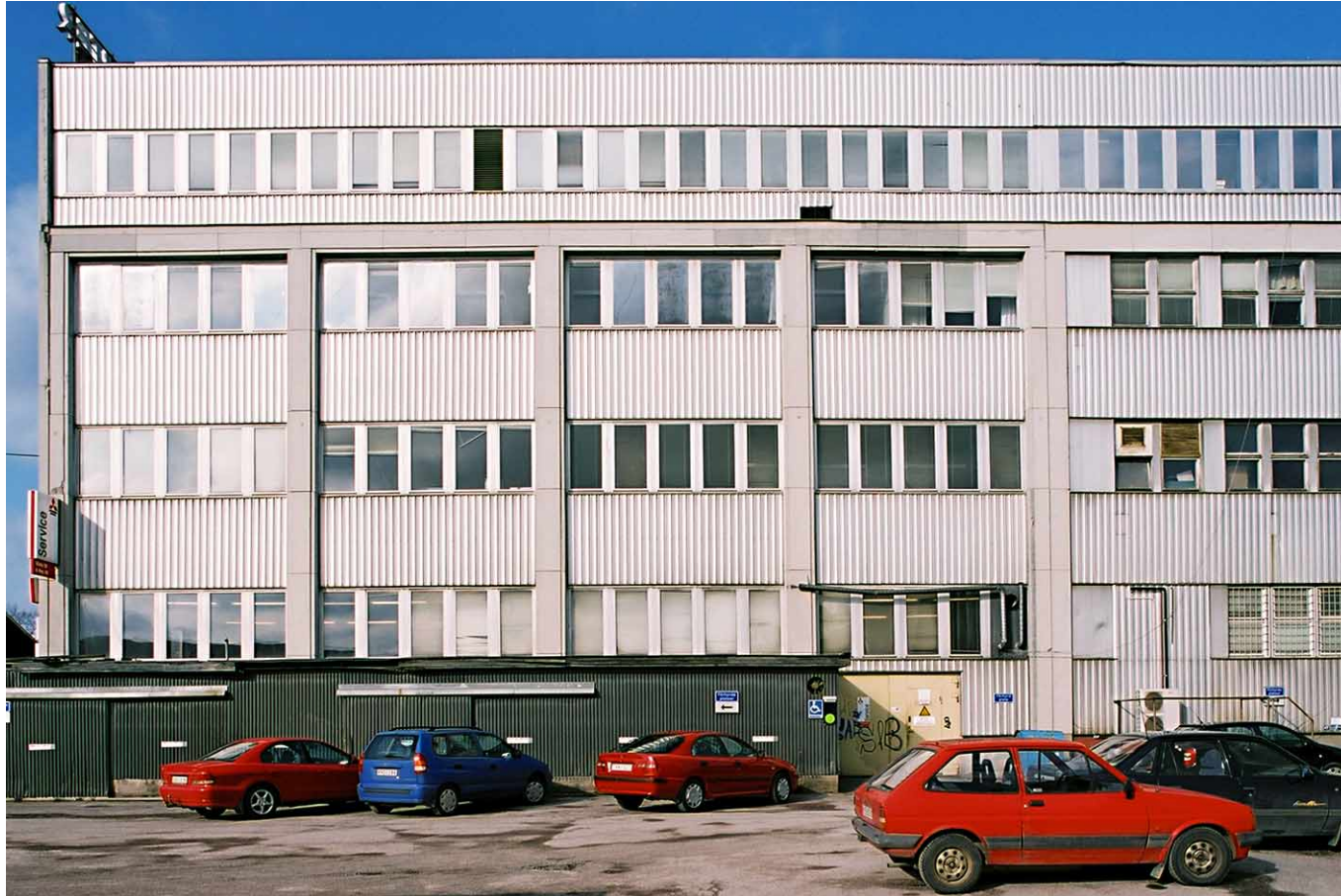
Samma byggnad som ovan, sydfasaden.