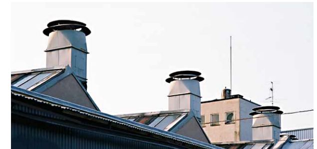
Ventilationshuvar på industrihallen från 1951.