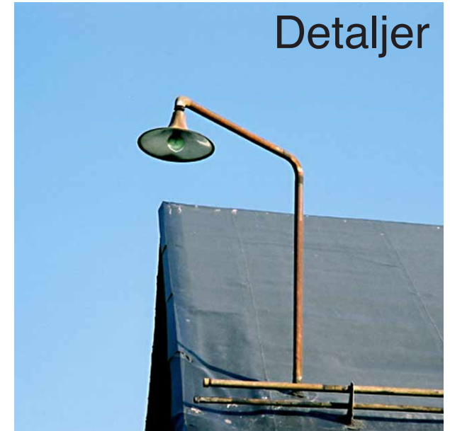
Belysning på de äldsta byggnaderna.