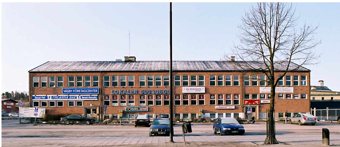
Kontorsbyggnaden från 1948, fasaden mot Centralvägen.