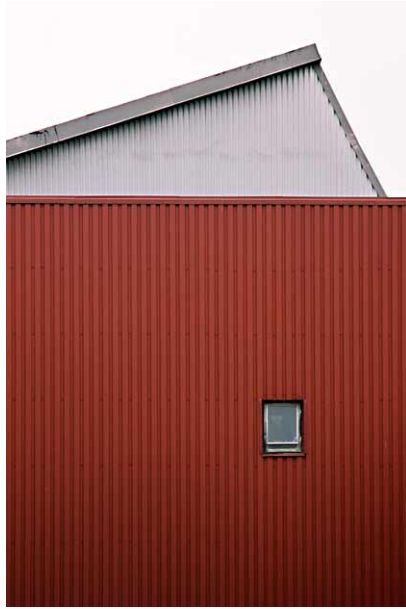
Fasadetalj på industrihallen för plastprodukter från 1961.