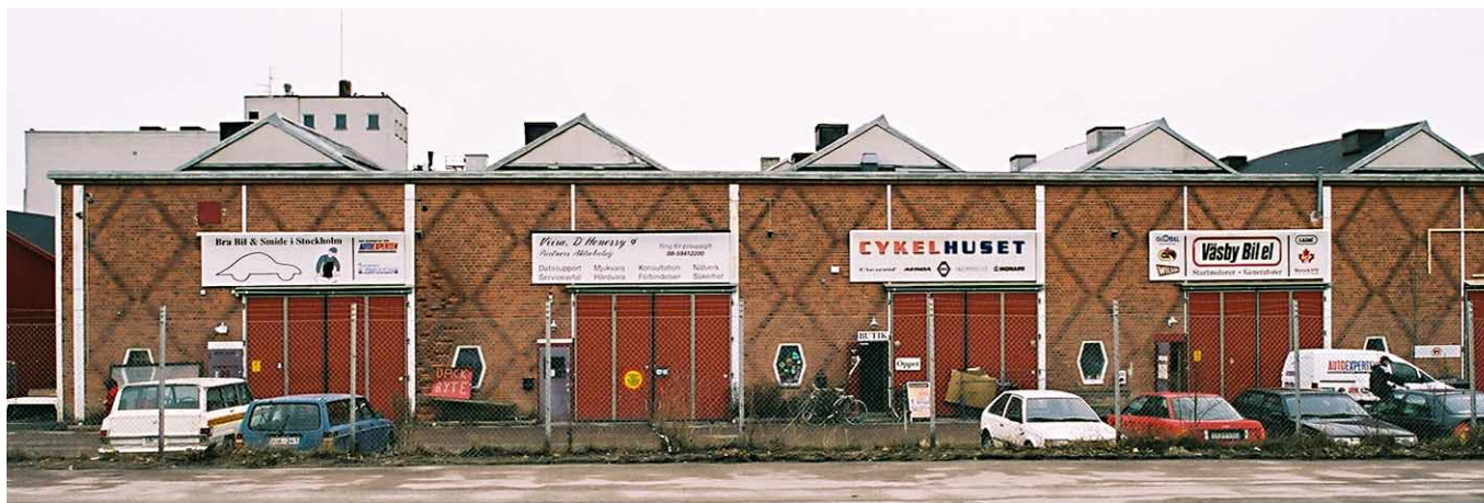
Östfasaden på industrihallen för pressgjuteri från 1948, med mönstermurning, senare tillkomna portar för att tillgodose ny användning för bl a bilfirmor.