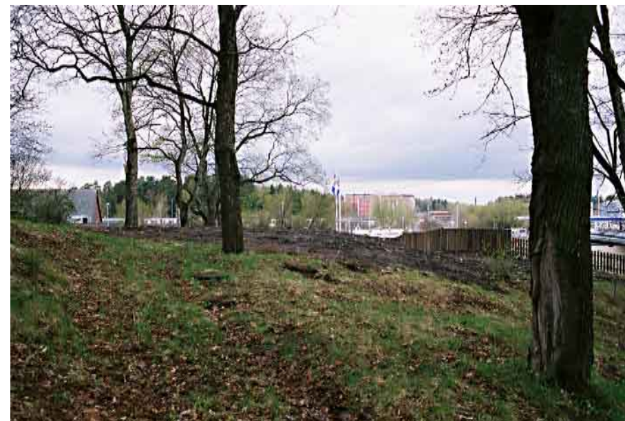
Bilden tagen i samma riktning som ovanstående bild.