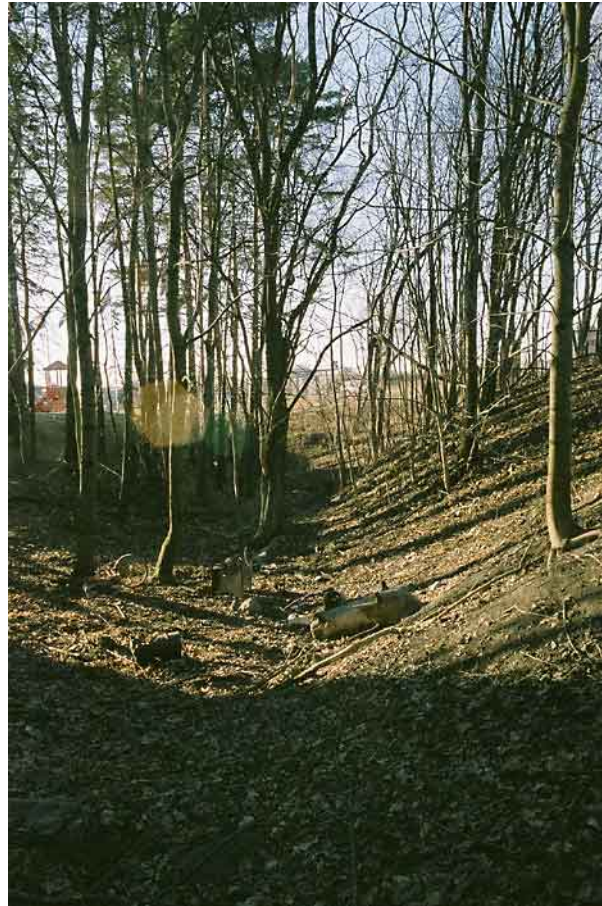
"Ravinen" nordost om de rivna byggnaderna, öster om (bakom) Burger King.