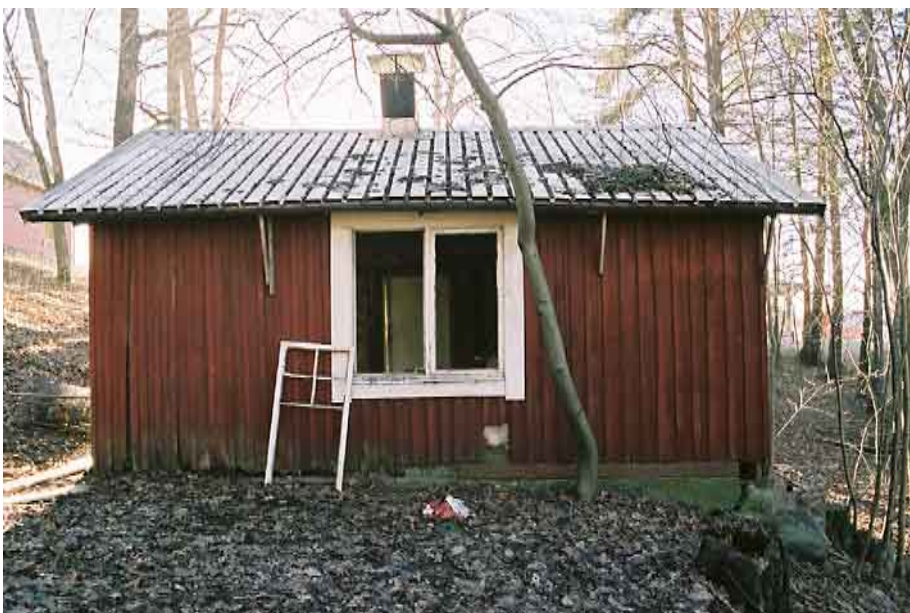
Lilla uthuset, ostfasaden