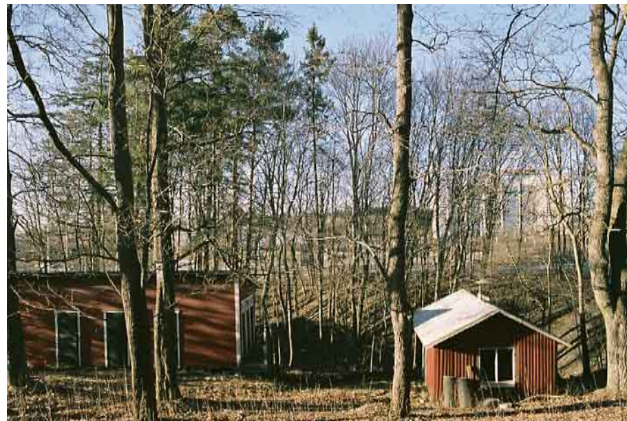
Uthusen från söder