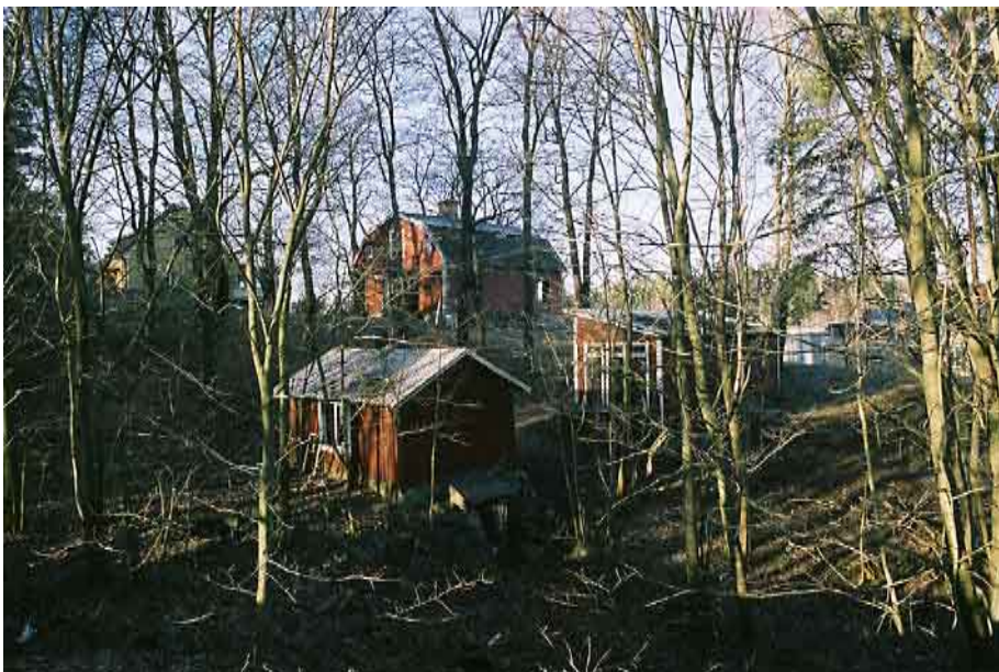
Uthusen från nordost