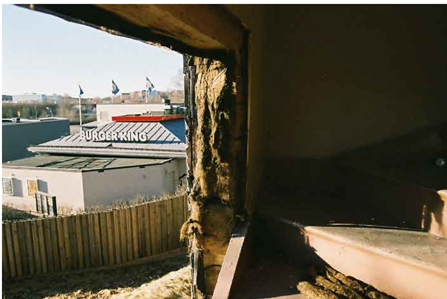
Huset hade en ordentlig stomme i liggtimmer.