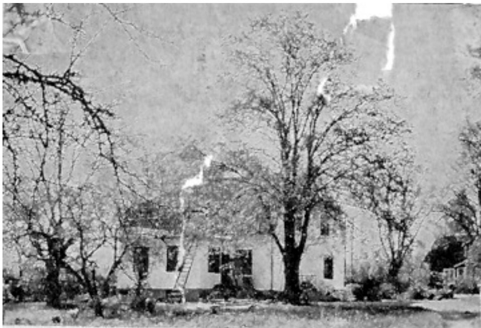
Återstoden av Bollstanäs gård, kallad "Gården". Troligtvis har den utgjort en flygel till den i övrigt nedbrunna gårdsanläggningen. Årtal: Okänt