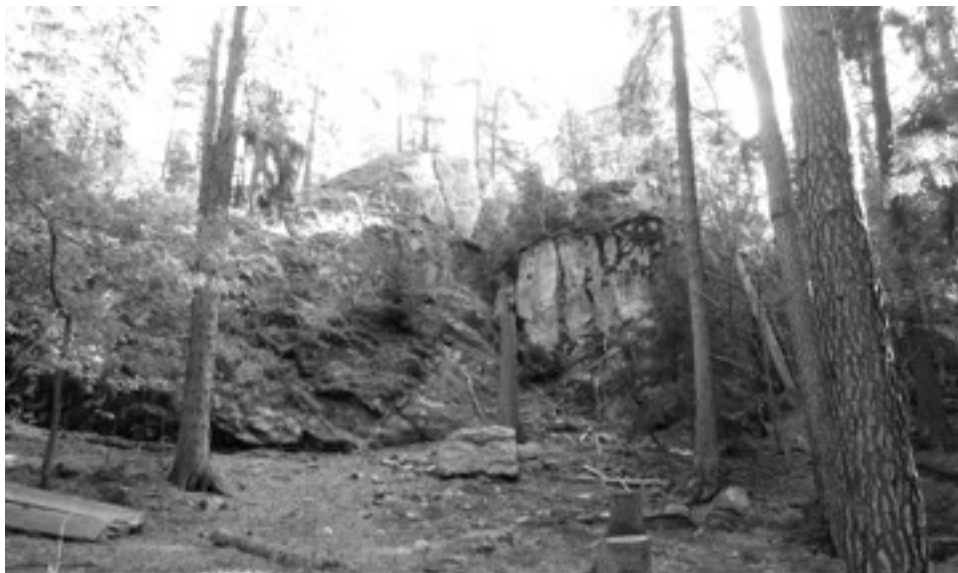
Den lodräta bergväggen som skall utgöra altardelen till "Klippkyrkan"