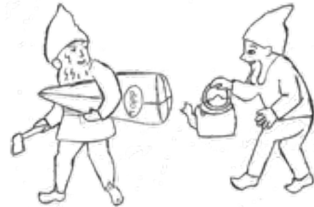
Broderimallar från 1880-talet

Allt sedan hedenhös har bonader, som Erik Axel Karlfeldt här skaldar om, satts upp i våra hem, och då alldeles självklart till de stora helgerna och andra högtidliga och festliga tillfällen. I de gamla stugorna var tak och innerväggar nakna och i många fall också sotiga av röken från husets öppna härd. För att försköna miljön hängde man upp bonader både i tak och på väggar. De kunde vara målade men det förekom även broderade och mönstervävda. I Småland och Halland, liksom i Hälsingland och Dalarna var målade bonader vanligast.