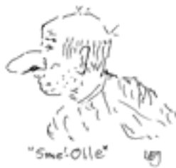
Sme-Olle. Teckning: L E Jansson

I författarens barndom i början av 1930-talet var gårdsmeden fortfarande aktuell på vissa gårdar i våra trakter. Vid Dyvinge gård i Hammarby socken bodde och verkade fortfarande den gamle smeden Olsson,