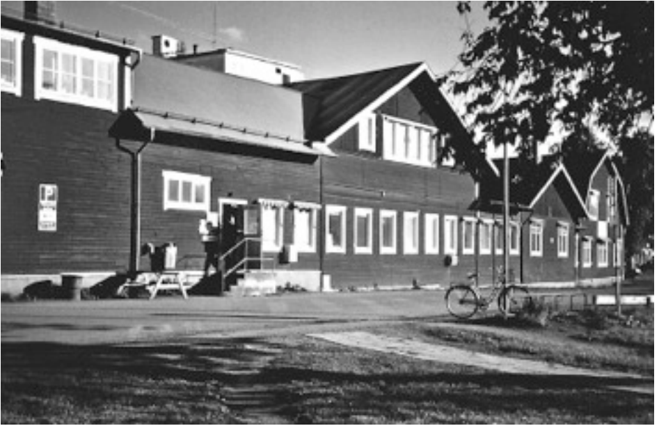
De gamla trähusen vid Metallverken