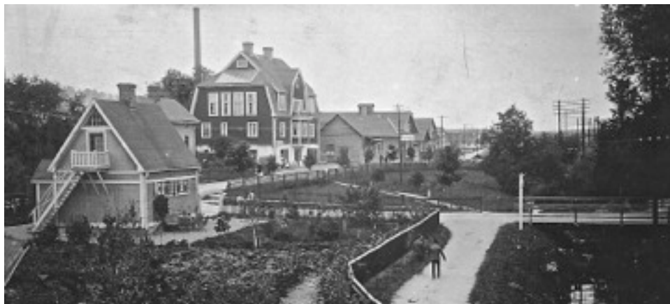
Bron över Väsbjån vid stationen i äldre tider.