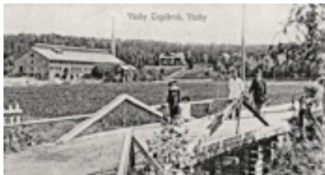
Väsby tegelbruk. Beskuret gammalt vykort.

Nu, när det skall bli ett helt nytt kvarter i området Tegelbruket, kanske det kan vara roligt att dra sig till minnes, hur det har varit förr i tiden.