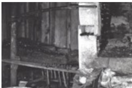
Dyvinge gårdssmedja. Interiör.