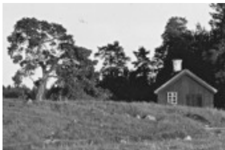
Dyvinge gårdssmedja belägen i Kobagen 150 m söder om ladugården.

”Sme-Olle”. Han hade vid den här tiden nått hög ålder, men utförde vid behov fortfarande sitt arbete med tillverkning och reparation av olika detaljer i järnsmide för gårdens och närliggande gårdars behov.