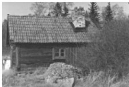
Gårdssmedjan vid Nibble gård, Hammarby socken på 1970-talet

När jag anlände till auktionen så mötte jag en påtagligt mycket lycklig man från Täby, som hade ropat in den intakta verktygs-