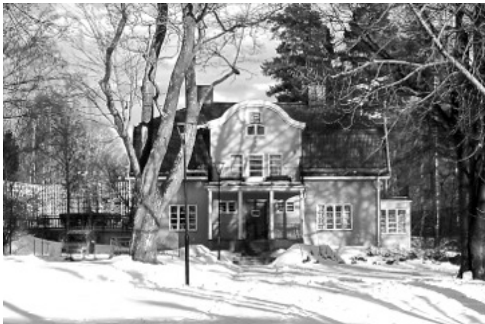
Vårvinterdag vid Villa Susebo 2013.