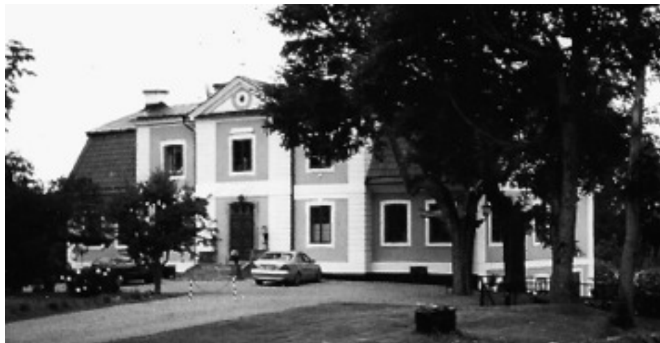
Det nutida Sköldnora.

Under början av 1700-talet fick huset förfalla och i februari 1718 såldes ruinen till uppköpare av byggnadsmaterial.