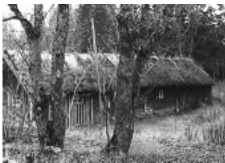
Eggeby ladugård 1945.

vid ekarna." Gården (byn) finns omnämnd vid en ärkebiskopsvisitation år 1363. I slutet av år 1660 gjordes Eggeby till säteri, d.v.s. herrgård som hade viss skattefrihet. Gården såldes i mitten på 1730-talet i nergånget skick till Gyllenborg på Torsåkers säteri. Denne ombildade gården till fyra torp. Eggeby säteribyggnad torde ha stått c:a 100 meter sydväst om det nuvarande huset, en parstuga. Den gamla ladugården med vasstäckat tak fanns ännu kvar i slutet av 1940-talet.