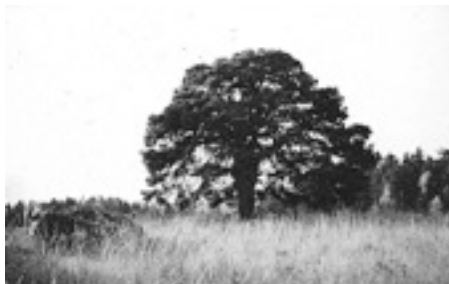
Dyvingetallen, Hammarby.

En gammal skröna från gången tid berättade att dåvarande bonden på gården beslöt att hugga ner tallen och skred till verket. Efter några yxhugg hörde han plötsligt en myndig röst som kommen ur vinden från Stjernborgsbergen. Den ropade: "Låt tallen stå, låt tallen stå!" Mannen blev förskräckt och gjorde som den okända, myndiga rösten uppmanat. Han släppte yxan och lät trädet stå kvar.