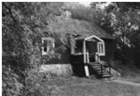
Eggeby, Hammarby socken.

Något hundratal meter söderut från "Björken" kom nästa grindhål genom vilket man kom in på Nibble gårds marker. Nu följde en c:a 400 meter lång vägsträcka som drog fram mellan Storbäcken och Lillbäcken, åkrar som låg norr respektive söder om vägen. Nästa uppehåll kom vid Nibblehagens östra grind. Sedan denna passerats, så drog vägen vidare över en stenig backe med Nibble bygravfält strax söder om vägen. Efter ett drygt hundratal meter kom vi fram till "Nibblegrinn", som grinden hette i folkmun. Den var den sista grinden att öppna och stänga på färden. "Nibblegrinn" var ett slags referenspunkt i terränglådan för folket i trakten.