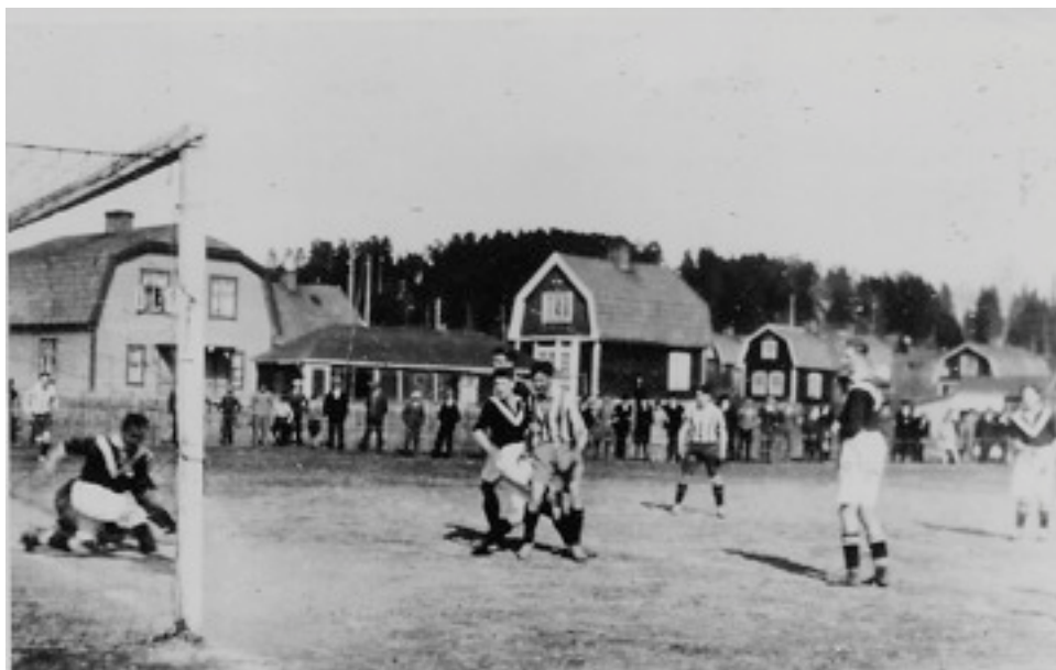
Match på Optimusvallen på 30-talet. Fotbollsplanen låg strax innan "Enbacken", där Elverket ligger idag.