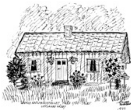
Gamla kaplansbostället. Teckning: Guggen Rosenbaum 1977

Pastorerna hade väl annan utrustning, t.ex. nattvardsutensilier, kanske också häst och vagn.