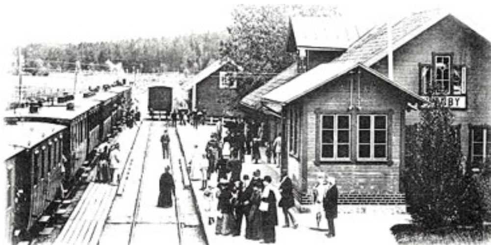
Väsby station 1880.