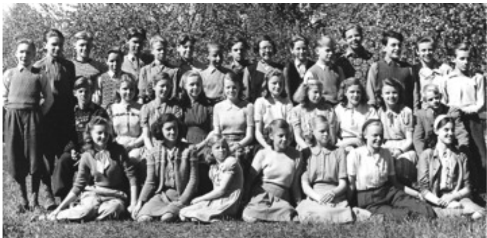
Skolfoto från 1947. Artikel författaren står som nr. 4 från höger i översta raden.