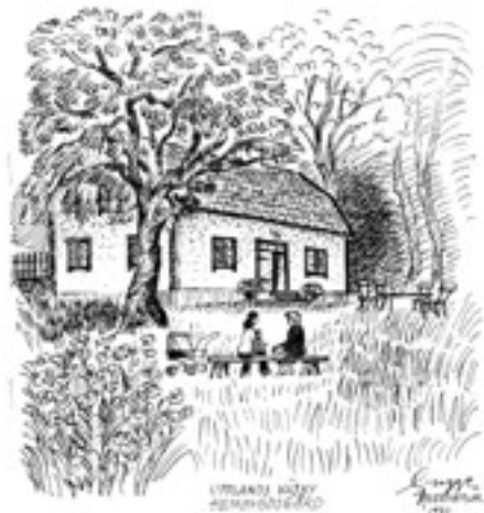
Nedre Runby. Vår hembygdsgård. Teckning: Guggen Rosenbaum 1977

Hembygdsgården, Nedra Runby, har inte alltid varit hembygdsgård. Om gårdens och Runbys historia berättar Egon Lindholm i skriften "Runby", som tidigare i sin helhet har publicerats i Hembygden.