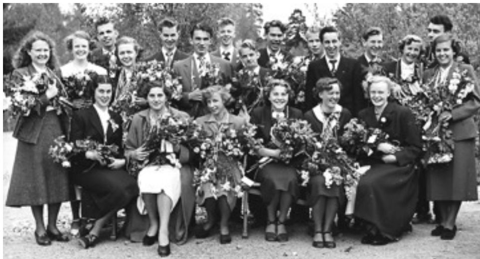
Realexamen 1951. Artikelförfattaren står som nr. 3 fr.v. i översta raden.

Som jag skrivit om i en tidigare berättelse hade vi förmånen att ha en kvinnlig gymnastiklärare, som förstod sig på oss ungdomar. Utöver den vanliga redskapsgymnastiken och utomhussporterna, så lärde hon oss vanlig sällskapsdans. Det lyckades hon genomföra trots en del motstånd från skolledningen. Det betydde att vi var ganska hyggligt utrustade för att lite blygt bjuda upp det motsatta könet. Något man hade nytta av när man kom ut i livet.