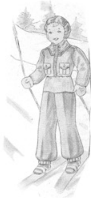
Skiddräkt för barn. Ur Allers mönstertidning 1937

sökte ideligen, stod på näsan, bröt av skidor. Jag minns inga brutna armar och ben, men backen var brant och rätt så farligt egentligen.