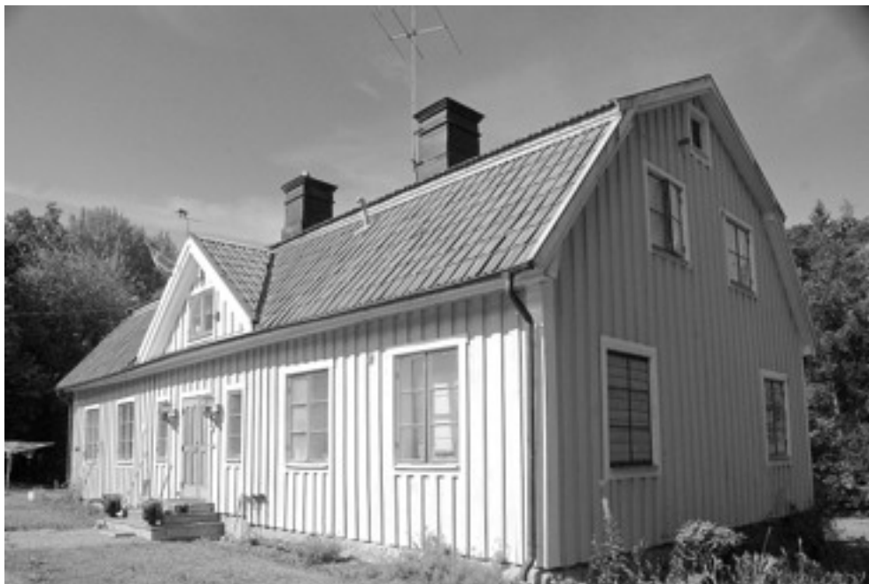
Lilla Wäsby som det ser ut idag.

mera för en oförklarad mordaffär beryktade Hammarby apotek, låg bara ett uselt halm-tak. Väggarna voro delvis insjunkna, fallfärdiga; genom fönstergluggarna kunde man