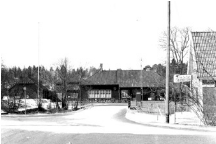
Väsby station på 1950-talet.

(Red:s anm: Nya Dagligt Allebanda var en konservativ dagstidning som utgavs i Stockholm 1859–1944.)