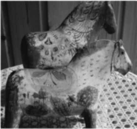
Överst "Nordsvensken" Isak. Nederst Isak i förgrunden och bakom honom Jakob.

Vid den här tidpunkten, i början på 1930-talet, var nog fortfarande ändamålet med de täljda trähästarna att de skulle tjäna som leksaker åt barnen. Så även i mitt fall. Jag lekte ofta och gärna med mina hästar. De ingick som dragare när jag i min sandhög i mina lekar följde de vuxnas göromål på åker, äng och i skogen, beroende på i vilken årstid man befann sig.