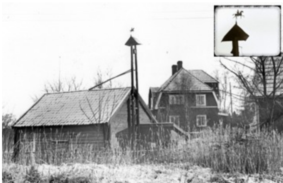
Nibble gård. (Notera vindflöjeln i form av en ryttare på vällinglockan)

utan denne blev en sventjänare under gården. Tiden var därmed mogen för Karl XI:s reform resulterande i det yngre rusthålllet. Det utgick från de faktiska förhållandena. Ryttarna uppsattes och underhölls medelst torp m.m., vilken skyldighet pålades skattejorden mot frihet från utskrivning. För varje rusthåll fanns en rusthållare (bonden på rusthållshemmanet eller r.-stammen) medan andra s.k. augmentshemman lämnade hästörantor. Antalet rusthållsregementen var fort-