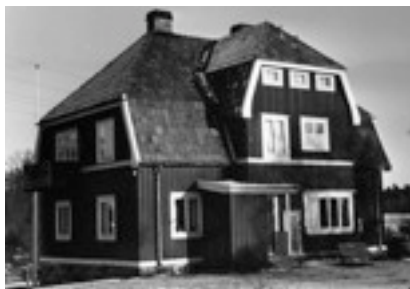
Nibble gård.

Karl XII förklarade att soldaten skulle vara bondens dräng. Bönderna kallades husbönder av soldaterna. När soldaten var i fält skulle bönderna sköta hans jord.