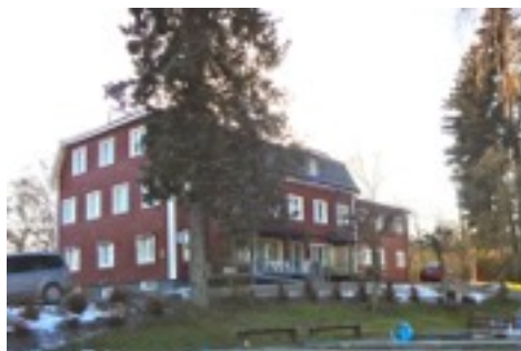
Eds f.d. ålderdomshem idag.