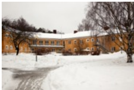
Odensgården, strax innan rivningen.

På 50-talet byggdes också det första pensionärshemmet för dem där fortfarande var båda makarna var i livet. Då är vi i modern tid