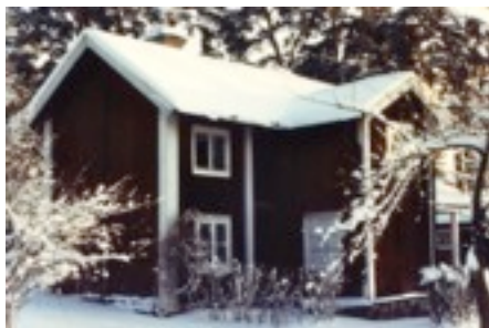
Hammarby Fattigstuga före sista stora renoveringen

1781 byggdes en ny stuga som var indelad i två rum. Ett av rummen disponerades fram till 1807 av församlingens klockare. 1844 var 17 personer inhysta i huset 8 vuxna och 9 barn.