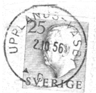
Stämpeln från Andreas Tärnholms samling.

Den 1 juni 1919 beslöt Postverket att ändra namnet på poststationen Väsby till UPPLANDSVÄSBY (utan särskrivning). Bakgrunden var att mycket post kom fel. Förväxlingarna mellan Väsby, Visby och Näsby var många. Och det fanns flera Väsby i Sverige. Väsby i Uppland blev UPPLANDSVÄSBY.