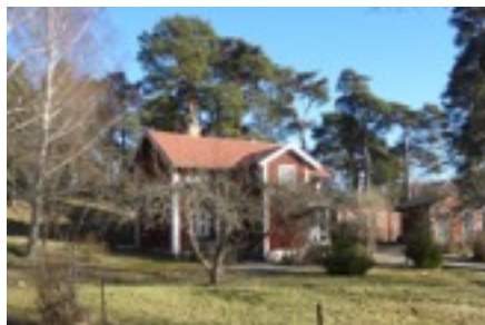
Hammarby Fattigstuga idag

1781 byggdes en ny stuga som var indelad i två rum. Ett av rummen disponerades fram till 1807 av församlingens klockare. 1844 var 17 personer inhysta i huset 8 vuxna och 9 barn.