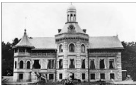
Edsby slott 1905.