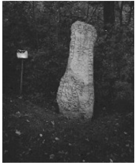
Runstenen vid Hammarby prästgård.

I Norden använde man runor ända in på medeltiden, t.o.m. ännu senare. Någon litte-