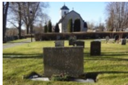
Stenen över Frestabrandens offer.