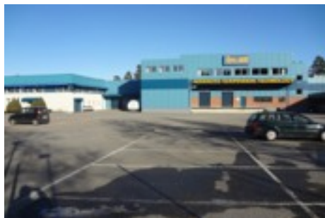
Samma plats som ovan idag.