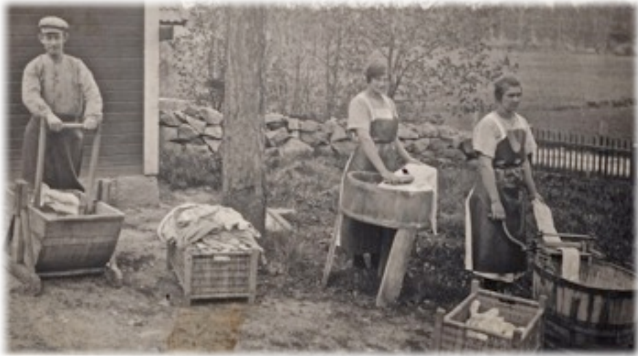
Karlsunds tvättinrättning omkring 1920.