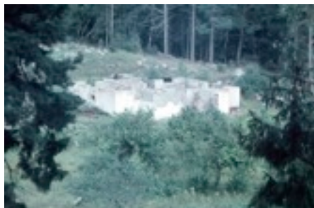
Resterna av Fresta ålderdomshem

År 1948 brann Fresta ålderdomshem ner till grunden. Åtta gamlingar innebrändes i den tre våningar höga träbyggnaden. Fyra av dem kunde inte identifieras. De ligger i en gemensam grav på Fresta kyrkogård.