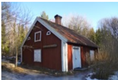
Fresta Fattigstuga idag.