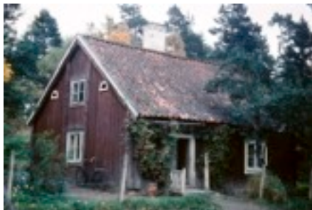
Fresta Fattigstuga på 1960-talet