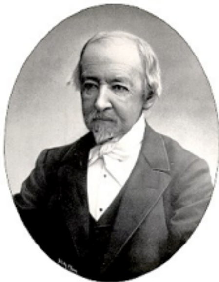
Zacharias Topelius 1818 - 1898

Topelius skriver ungefär femtio år senare om detta brev följande: