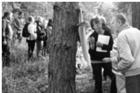
Framme vid Berga källa.

I Upplands Väsby finns ca 50 källor men det är inte många som känner till dem eller vet var denna naturskatt gömmer sig. Inte många av dessa källor är "igång" och användbara eller ens möjliga att hitta. Flera av dem har vi i åratal passerat i skog och mark men inte känt till, att de finns där.