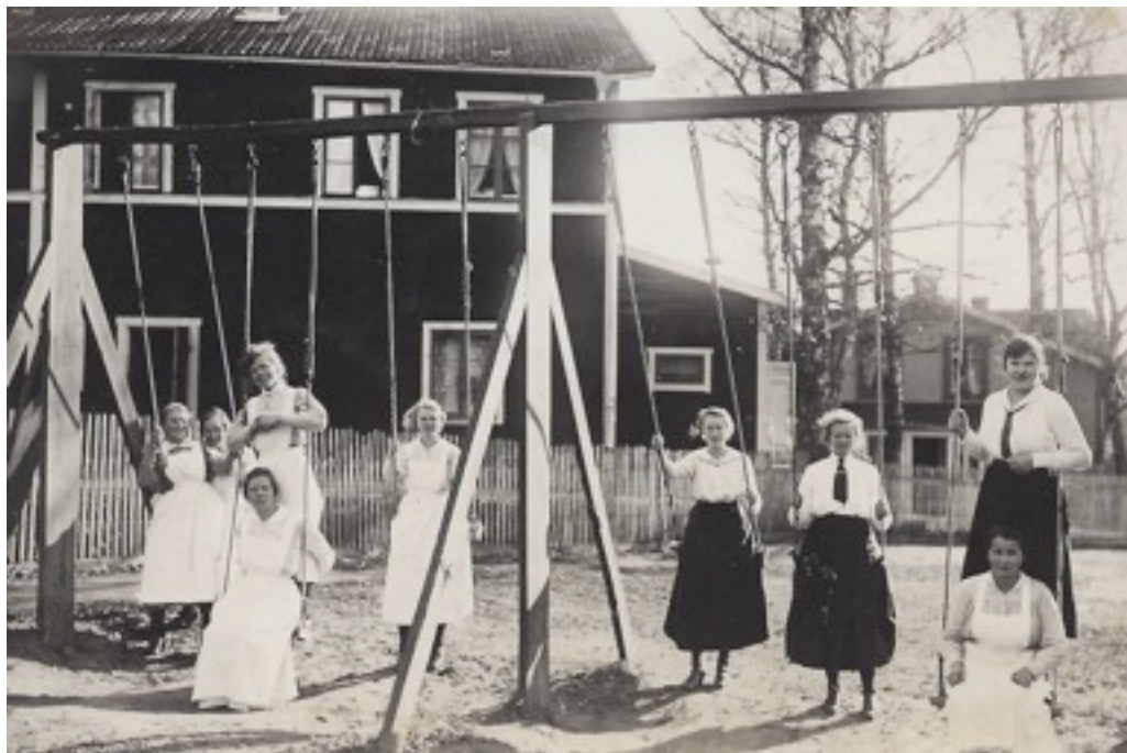
Carlslundsflickor på 30-talet. I bakgrunden flickhemmet och Strömgrens hus.

Hon var där ett par år och kom tillbaka 1958, då hon började i köket. Det var bästa arbetstiden, när man hade familj hemma.