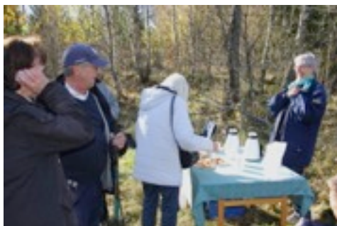
En stärkande tår.

Ungefär halvvägs, mitt i skogen på gränsen till naturreservatet hade vi fixat kaffe och bröd för