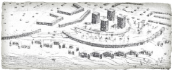
Runbyvision från -58

ten av Runbyvägen 12 i en båge norrut utmed den nya Hagvägen, som placeras väster om den nuvarande. Dessa två hus beräknas rymma 288 lägenheter, 108 i den förstnämnda och 180 i den senare.