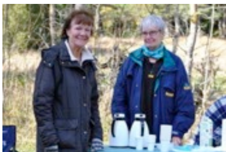
Glada kaffeböner.

Vi fick också lov att kalla på förstärkning till vårt kaffe-o-bröd-förråd.....tack vare snabbutryckning av goda hembygdsföreningskollegor