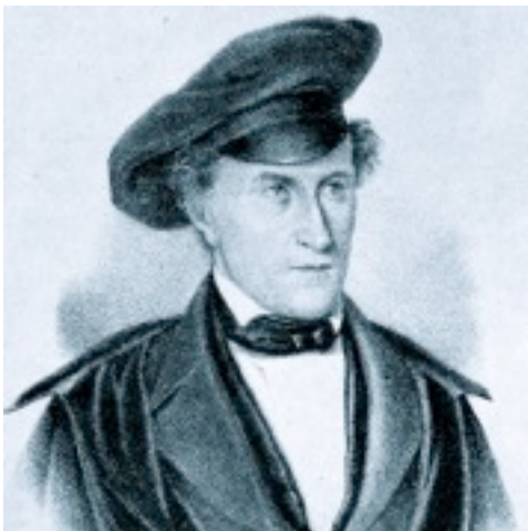
Carl Jonas Love Almqvist porträtterad 1843 i Nordstjernan.