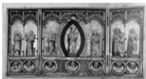
Altarskåpet från 1470-talet.

Så kom höjdpunkten på vandringen; guidningen i Fresta kyrka. Inne i kyrkorummet kunde vi beundra altartavlan från 1470-talet, orgeln från