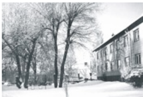
Vallvägen 6 från baksidan vintern -85.