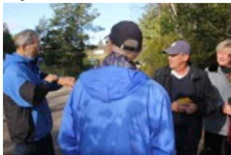
Klart för start.

Den traditionella Vikingalunken, en gemensam aktivitet mellan Hembygdsföreningen och Friluftsförbundet, gick av stapeln den 7 oktober. Start och mål var vid Främjartorpet i Fresta och slingan var i år ca 7,5 km.