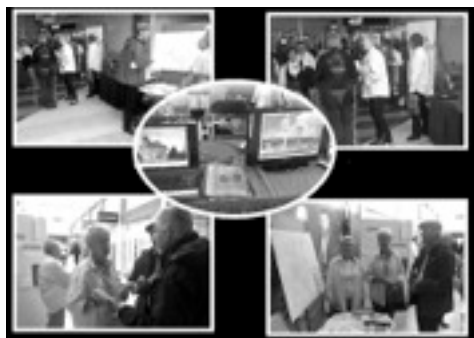
Collage från mässan.

Den sjätte oktober gick årets föreningsmässa av stapeln, ett evenemang som ger ortens föreningar tillfälle att visa upp sig och göra reklam för sin verksamhet. Hembygdsföreningen deltog med bokbord fyllt av Väsbylitteratur, en dator och en TV-skärm med olika bildspel samt en stor karta över de femtiofem källor som funnits i Eds, Hammarbys och Fresta socknar en gång.