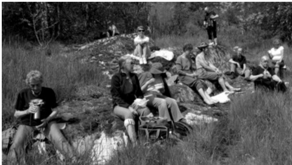
Lunchfika vid runstenen i Skalmsta.