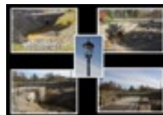
Collage av Stenbron

Stenbron till bäckens utlopp i Norrviken. Vi samlades vid busshållplatsen Pepparbodavägen, 15 personer och tre hundar anslöt