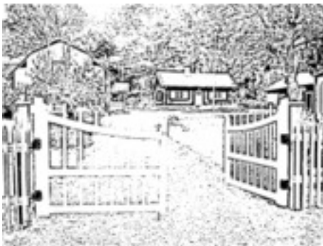
Hembygdsgården, Hembygdsgården, Hagvägen2/Pukslagargatan.

Hembygdsgården ligger inte längre bort än att man kan gå, cykla eller ta bussen dit. Alla är välkomna, inträdet fritt.