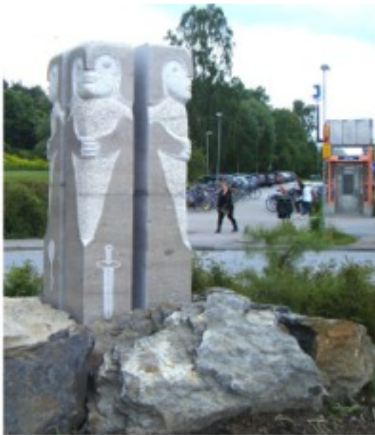
Skulpturen Ingrid i Västra Järnvägsparken.