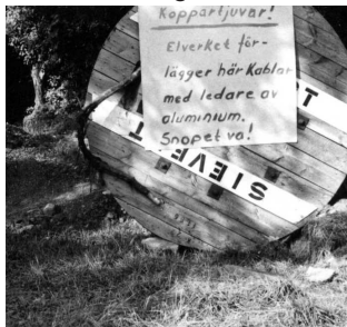
"Info" till koppartjuvar.

När jag tillträdde elverksjobbet i Väsby fann jag efter några månader att två gamla fastigheter inte hade el. Jag besökte de båda husägarna för att höra om de blivit bortglömda eller inte ville bli