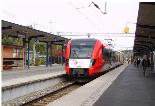
Upptåget kommer till Väsby station

År 1939 ändrades namnet på järnvägsstationen från Väsby till Upplands Väsby på grund av ständiga förväxlingar med Visby.