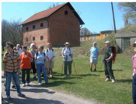
Från vårvandringen

I år hade vi samlat nästan 30 personer till denna tradition.