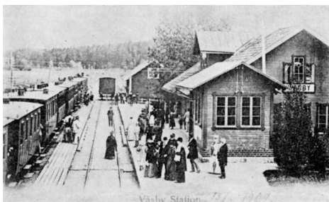
Stationsområdet före 1902. Vykort

FÖR ATT BYGGA en järnväg öster om Sigtunafjärden mellan Stockholm och Uppsala hade år 1859 bildats ett bolag, som nämnda år gick till Kungl. Maj:t med hemställan om proposition till rikets då församlade ständer om erhållande av räntegarantier på det för banans byggande erforderliga kapitalet. Då någon sådan proposition ej avgavs, väcktes av greve H.A. Hamilton hos ridderskapet och adeln en motion i frågan. Denna motion avslogs av riksdagen. År 1862 gjorde bolaget en ny framställan till Kungl. Maj:t om avlåtande av proposition till 1862-1863 års riksdag i och för banans anläggning av staten. I motsatt fall anhöll bolaget, som numera övertygat sig om banans goda finansiella utsikter, om koncession å järnvägens utförande. Vidare meddelade bolaget – om banan byggdes av staten öster om Sigtunafjärden – att bidra till expropriationskostnaderna ett belopp å 115.358 rdr 25 öre, därav Uppsala stad 100.000 rdr, varjämte inte blott Uppsala stad förbundit sig att av stadens mark kostnadsfritt upplåta mark utan också att fler enskilda jordägare erbjudit sig att utan ersättning avstå dem tillhörig för banans läggning erforderlig mark. Staten komme härigenom inte att vidkännas några kostnader för mark för järnvägens framdragande. Till slut anhöll bolaget för undanröjande av