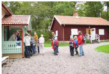
I kö för startkort

Under mottot ”Sätt Sverige i rörelse” gick Vikingalunken den första oktober. Vikingalunken är ett återupplivat motionsarrangemang från 1970-talet, där Hembygdsföreningen och Friluftsförbundet samarbetar.