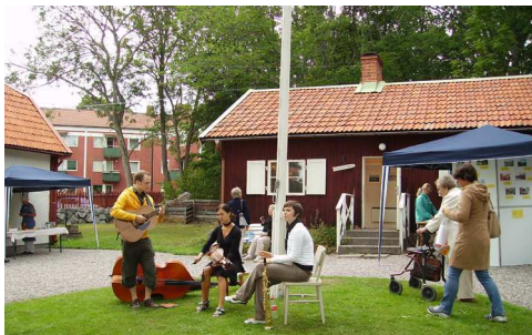
Jonika trio spelar vid Hembydsgårdens dag