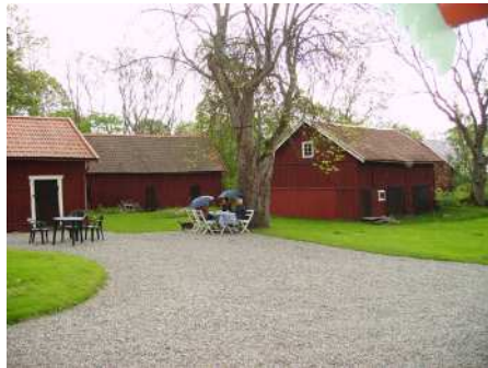
Våt och kall inledning på den heta sommaren