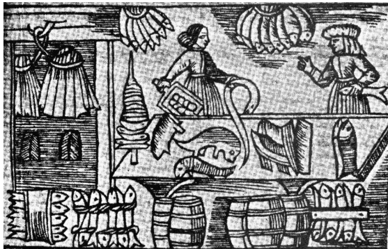
Fiskaffär på Olaus Magnus tid

Att äta lutfisk hör julen till, eller hur? Det är nästan enbart till jul – möjligen till advent och någon annan högtid, som vi idag äter lutfisk. Under gångna århundraden åt man lutfisk när som helst under året. Olaus Magnus skriver: ”Framför allt äta de nordiska folken torr fisk såsom gädda, gös, braxen och den fisk som man på götiskt tungomål kallar sik. Alla dessa fiskar travas upp i staplar. När man nu vill bereda dessa fiskar till människoföda låter man dem ligga två dagar i stark lut och en dag i rent vatten för att de måtte bli så mjuka igen som man vill ha dem; sedan de så kokats med tillsats av salt smör, sätter man fram dem på själva furstarnas bord såsom en läcker och omtyckt spis.”