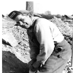
Harry i grävartagen.

Den andra fastighetsägaren omvandlade sina jordiska ägodelar till stiftelsen Adolf Stafs Fond, som kommunen förvaltar. Fonden vill främja vården av behövande äldre i vår kommun.