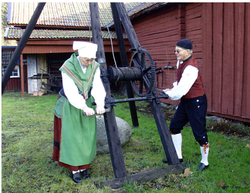
Össebydräkten är augusti månads dräkt.

Nu är det dags igen att inhandla den vackra Dräktalmanackan! Bättre för varje år!