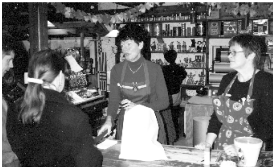
I handelsboden-gamla sädesmagasinet-vid Västanfors