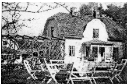
Familjen Pethrus boningshus.

I vårt hem har barnen varit efterlängtrade och älskade allt eftersom de kommit. Vi har