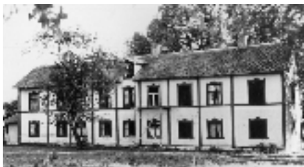
Vita gården, Runby