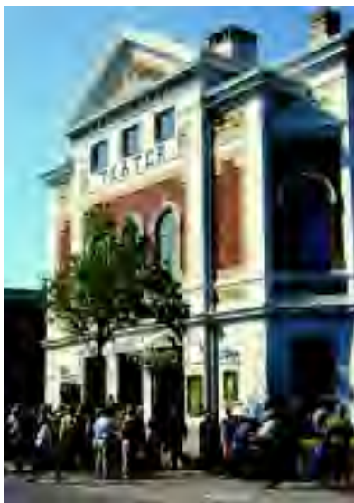
Varbergs teater från 1894.

Förhandlingarna öppnades av värdeorganisationens - Halländska hembygdsrådets