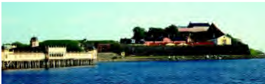
Kallbadhuset och Varbergs fästning

Årets värdstad Varberg är en trevlig småstad med gångavstånd till det mesta. För många är staden kanske främst känd för den i början av 1900-talet grundade cykelindustrin. Mot havet präglas staden av den magnifika fästningsanläggningen av medeltida ursprung. I stadens centrala delar dominerar spåren av 1800-talets framväxande kur- och badortsliv: Societetsparken med Societetsrestaurangen från 1886, kallbadhuset från 1903 och varmbadhuset från mitten av 1920-talet. De båda badhusen är förtjänstfullt renoverade under de senaste åren.