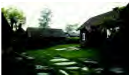
Äskhults by i norra Halland.

Färden fortsatte sedan vidare till Fjärås Bräcka, Hallands kanske märkligaste natur- och kulturlandskap. Bräckan är en 3 km lång och 500 m bred naturlig dammvall mellan sjön Lygnern och Kungsbackafjordens jordbruks-slätter och utgör ett uråldrigt bosättnings-läge och färdväg. Tyvärr var vådrets makter emot oss med ett ihållande regn som gjorde att vi här bara fick bese detta fantastiska land-skap från bussen.