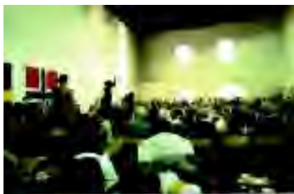
Högtidsmiddagen med gycklarupptåg i Rikssalen på Varbergs fästning.

På lördagskvällen var det hembygdsfest på Åkulla friluftsgård i det centralhalländska