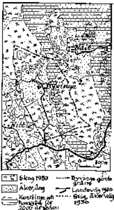
Fig.1 Karta Dyvinge 1930 med inritad kustlinje/havsvik vid Kr.f. Den första bosättningen låg på havsvikens västra strand.