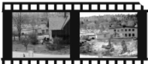
Barbacka's rivning maj -86. Höger bild "Bleckis"