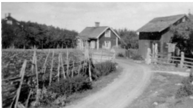
Fig.3 Dyvinge gårds undantagsstuga i början på 1930-talet.

Man hade nu övergått från tröskning med slagor till ett modernare redskap, ett tröskverk som drevs med s.k. "vandring", d.v.s. ett stort hjul med vertikal axel som drevs runt med hjälp av en förspänd häst som gick runt i en cirkelformad bana, "vandring". Hjulets rörelse överfördes mekaniskt och drev tröskverket. Gossens uppgift var att köra vandringshästen runt, runt timme efter timme, ett nog så monotont och krävande arbete för en tioåring.