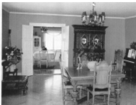
Samma miljö som i bilden till vänster. (Matsalen skymtar mellan de öppna salongsdörrarna.) Foto: Gösta Åsberg 1997.