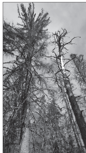
Granbarkborreangripna granar på Tuskösundets naturreservat

De små krypen är bra på att kommunicera via dofter. När en hane luktat sig fram till en stressad gran börjar den borra sig in i den. Granen svarar genom att försöka dränka barkborren i kåda. Då kallar barkborren på sina artfränder med en särskild doft, ett feromon, som han tillverkar i sin kropp med hjälp av granens kåda. Alla granbarkborrar, både hanar och honor, som flyger förbi känner doften och samlas på den stressade granen. Hanarna börjar omedelbart gnaga sig in i barken överallt. Granen försöker dränka alla i kåda, men till slut orkar den inte längre.