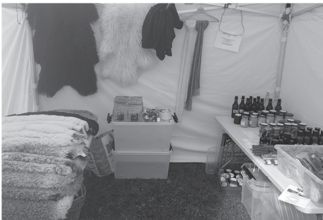
Mellangårdens rika hemproducerade utbud

Tvärnö Hembygdsförening fanns på plats med traditionellt loppisbord och information om föreningens