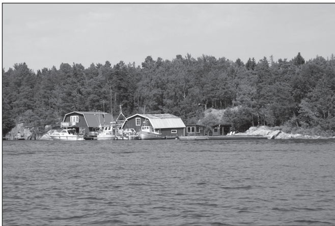
Sjöbodarna och fiskeflottan på Fälön. En välkänd bild

Den 21 juli var det då dags för årets sommarutflykt, till Fälön. Det var årets varmaste dag, temperaturen låg kring 36 grader och Örskär uppmätte den högsta medeltemperaturen någonsin. Undertecknad, som inte är någon värmeälskare, var minst sagt lite orolig för hur vi skulle klara detta, men det var bara att ladda upp med mycket vatten, paraply och keps.