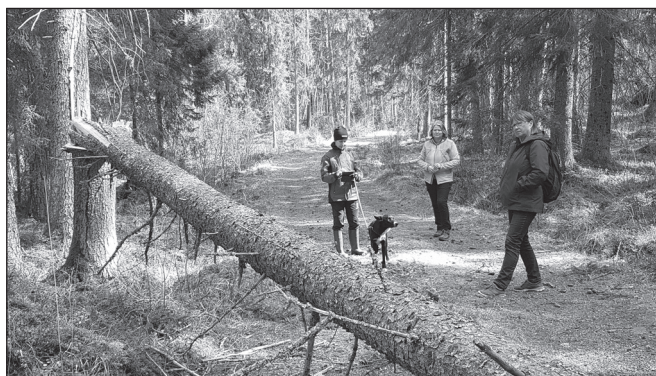
Granarna var påverkade på flera ställen i reservatet

Det blev en intressant promenad för oss som inte varit där tidigare. Vi kunde konstatera att det var ganska igenvuxet på många håll. Många granar var döda på