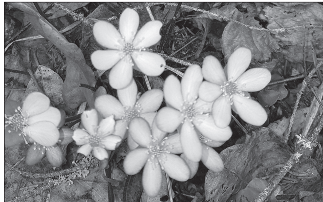
Vi såg vita blåsippor bland de vanliga blå och lila

Längre fram i tidningen beskrivs granbarkborren närmare.