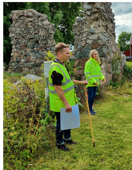
Upplandsmuseets experter berättar om ruinen i Husbyborg