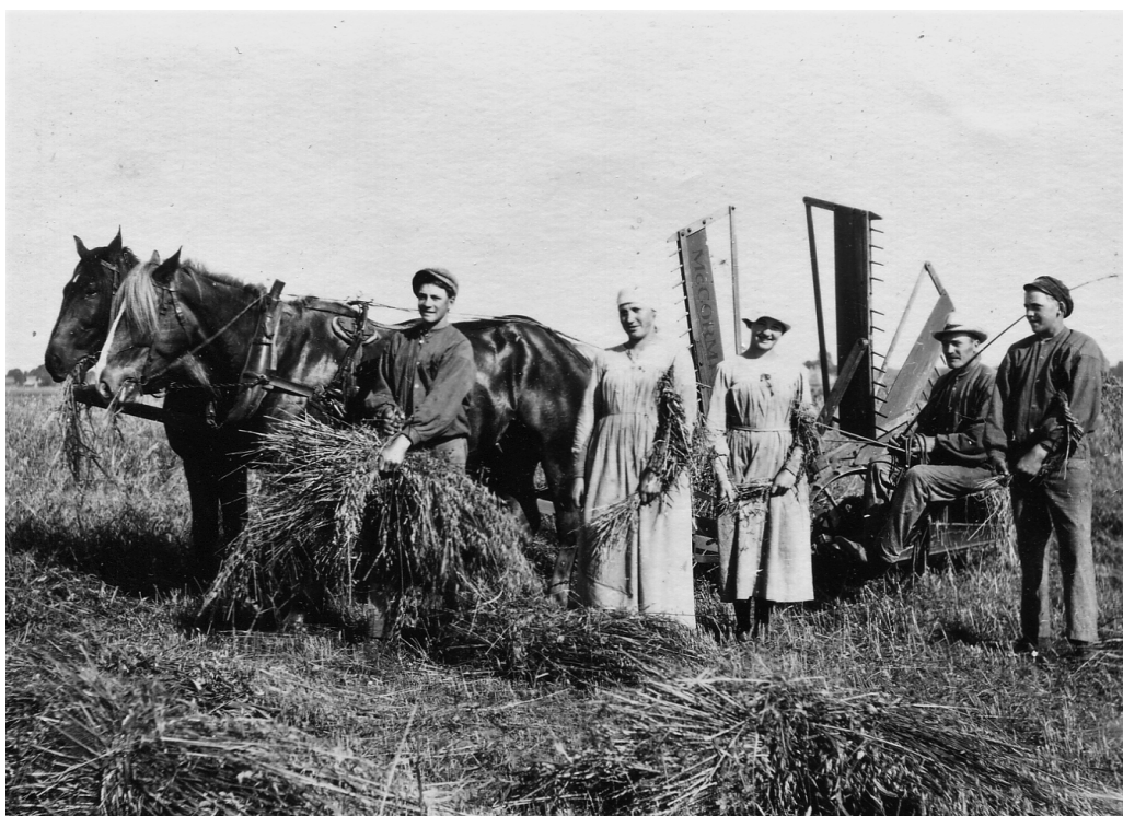
Bild från hembygdsföreningens arkiv, okänt var och vilka, men kanske såg det ut så här på 1920-talet när man slog på Hallsbo-öarna.

Öarna såldes omkring 1935 till Stockhoms stad, men ännu idag är många Hallsbor missnöjda över att öarna såldes alldeles för billigt.