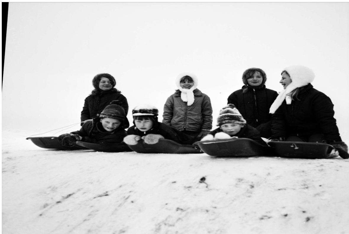
"Tefatsåkare i Torslunda", Uppland januari 1968, Arbetarbladet

När det äntligen blev en vinter med lite snö så kom snabbt frågor om var i Tierp man kan hitta en bra pulkbacke. Det fick oss i hembygdsföreningen att minnas tillbaka till när Torslunda var något av ett vintersportcentrum i bygden. I vårt arkiv har vi ett antal klippböcker med artiklar som sträcker sig från början av 60-talet till början av 80-talet. I dessa kan man följa aktiviteterna i Torslunda och vi ska här försöka sammanfatta lite nutidshistoria runt Torslunda.