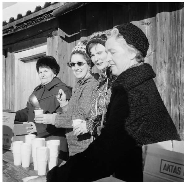
Servering under skollovsveckan i Torslunda. Arbetarbladet Källa: (www.digitalmuseum.se, licens CC BY-NC-ND*)

Nästa milstolpe i Torslundas utveckling blir när Lions skänker 5000 kr från barnensdagsfirandet i Tierp som bidrag till el-ljusspår. Tierp och