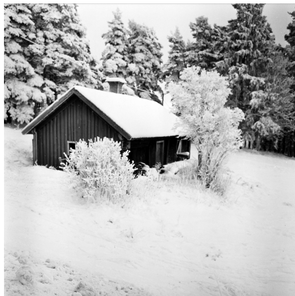
Soldattorpet i Torslunda 1967