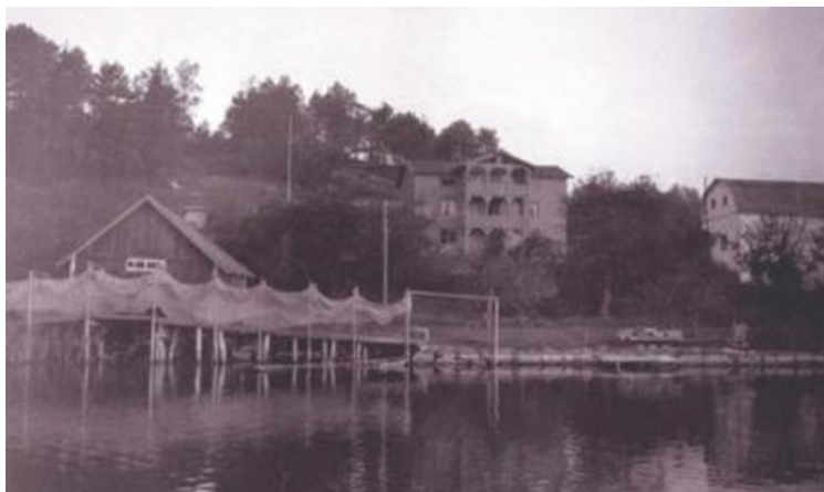
Strömma 1901.

Position 59.28705 18.55863. Tidigare artiklar i nr 21, 78 och 100.