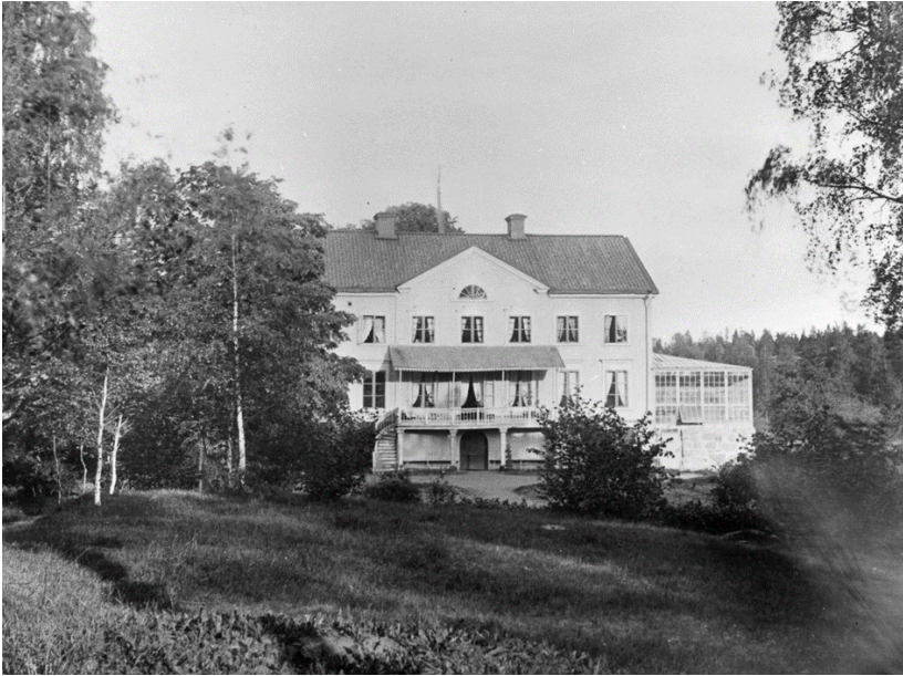
Viks gård 1890.