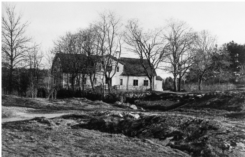
Tuna 1890.

Position 59.32086 18.55818. Inga tidigare artiklar.