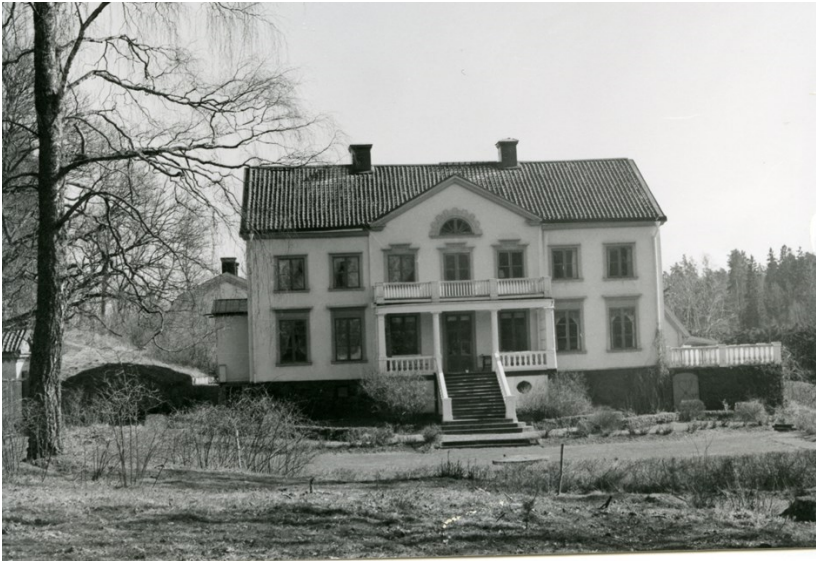
Viks gård ca 1990.