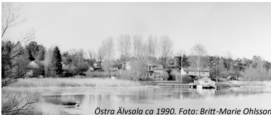
Östra Älvsala ca 1990.