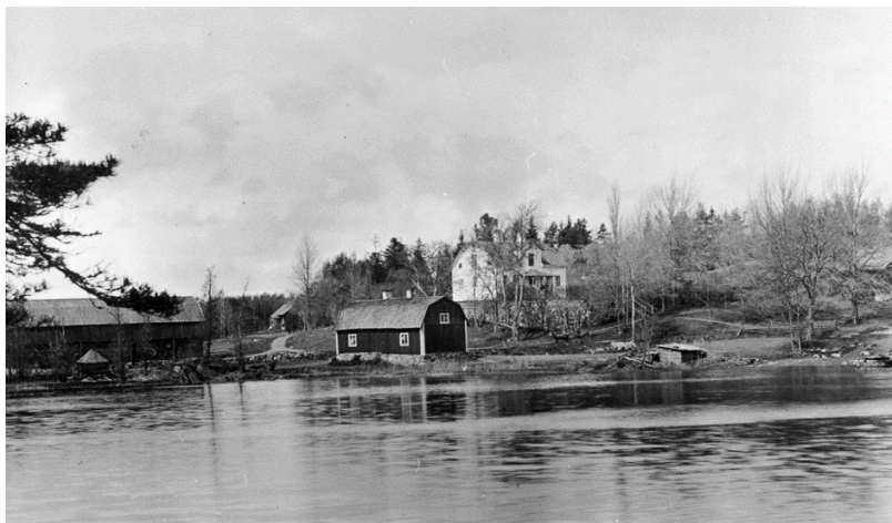
Malma gård 1890.

Position 59.26374 18.59174. Tidigare artiklar i nr 6, 26, 42 och 60.