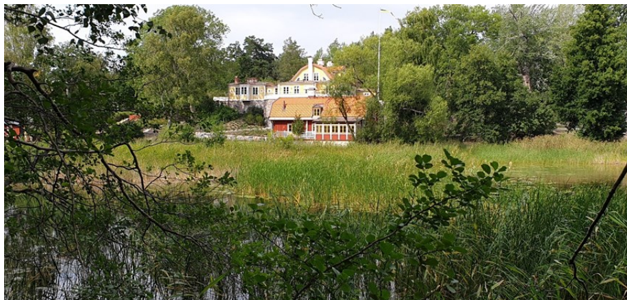
Malma 2019.