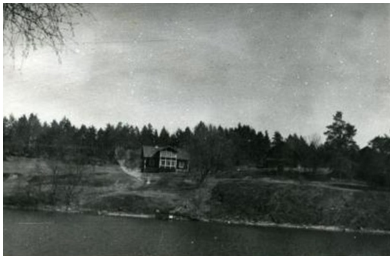
Herrviks gård 1938. Idag syns inga spår av gården.

Herrvik har i alla tider legat under Viks gård, se under denna.