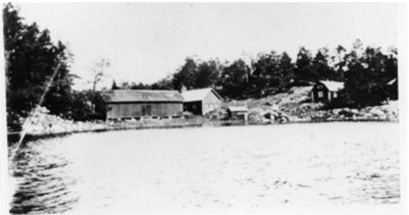
Tavastboda ca 1915.

Position 59.26304 18.6403. Tidigare artikel i nr 63.