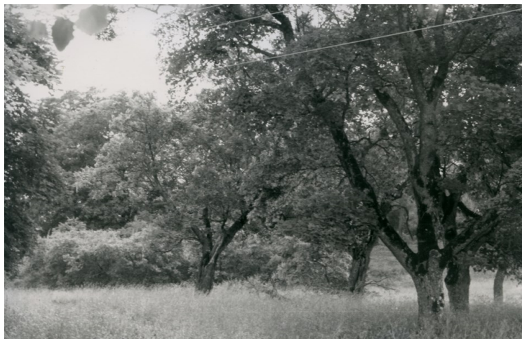
Här låg Tuna, strax till höger om Fagerdalavägen. Foto: Britt-Marie Ohlsson, ca 1990