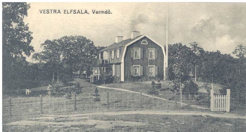
Västra Älvsala 1890.

Position 59.30043 18.63013. Inga tidigare artiklar.