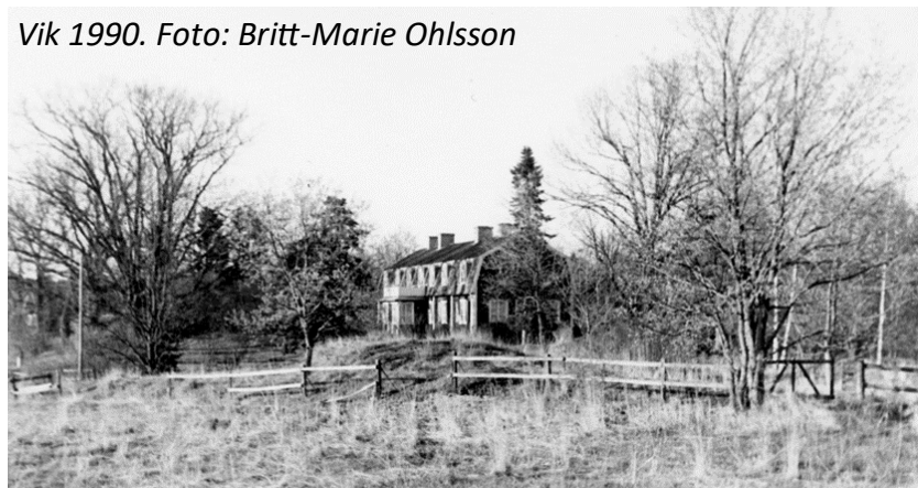
Vik 1990.