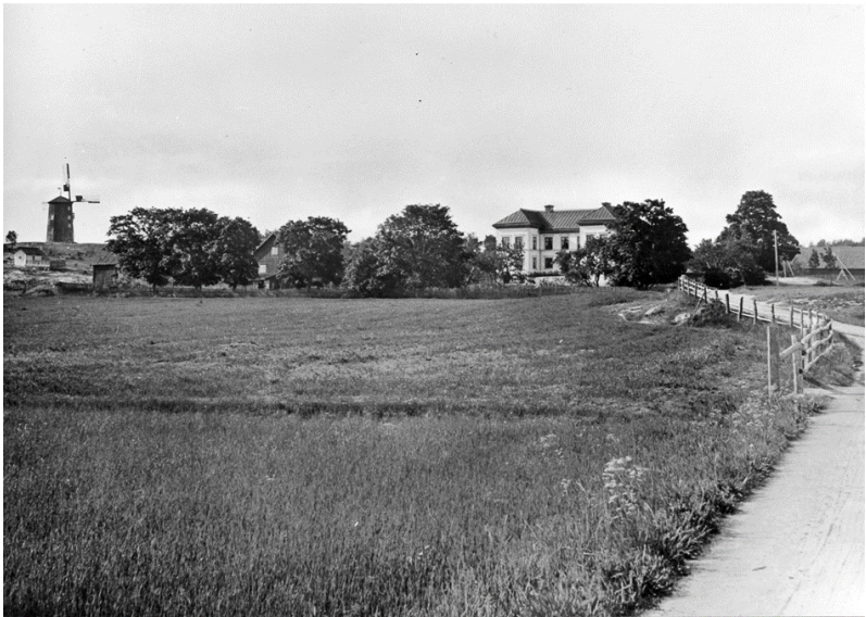
Hemmesta gård 1890.

Position 59.32619 18.50349. Inga tidigare artiklar.