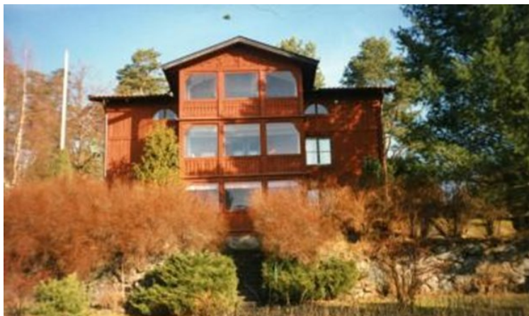
Strömma 1998.