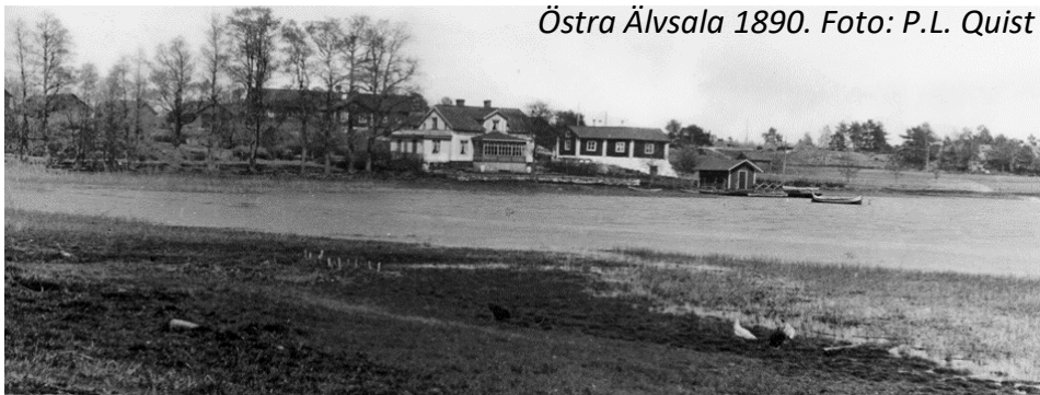
Östra Älvsala 1890.