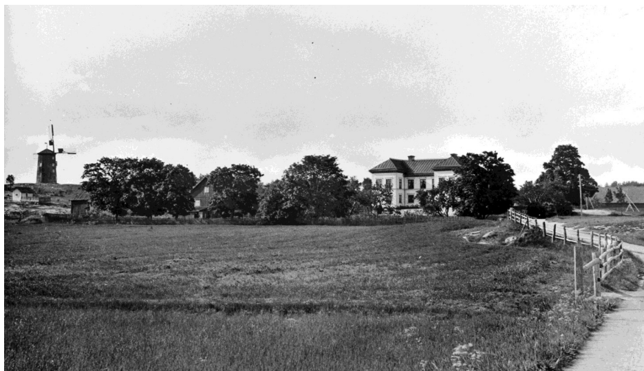
Hemmesta Gård 1890. Lägg märke till väderkvarnen på det kalhuggna berg som idag är Hemmesta Storskog.