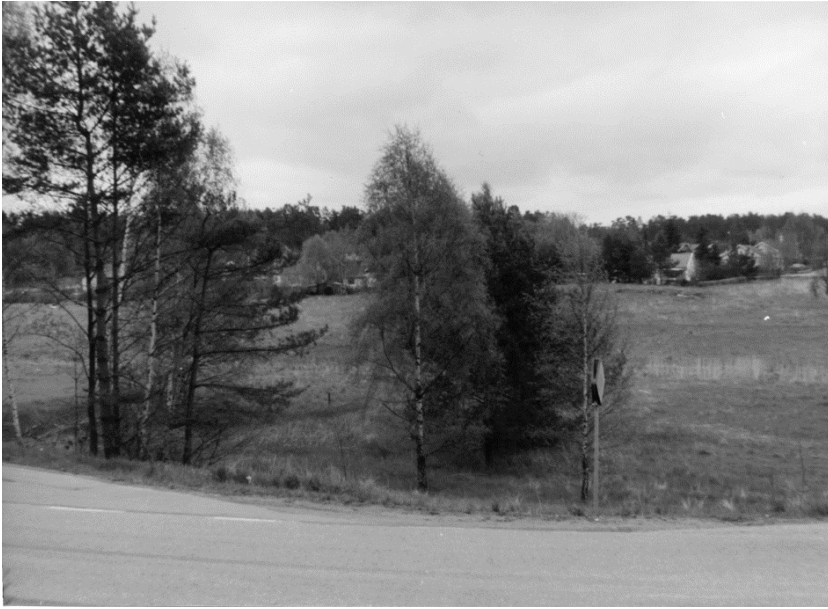
Läget där Hemmesta gård låg, intill nuvarande Skärgårdsvägen.