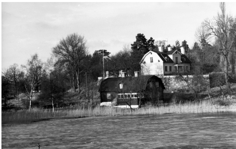
Malma gård ca 1990.