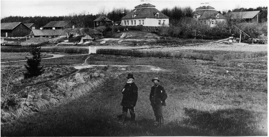
Fågelbro 1890. På bilden far och son Silfverhjelm.