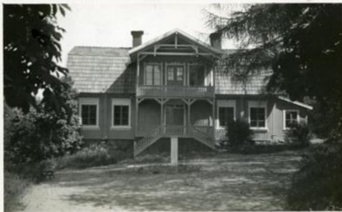
Pensionatet Marielund. Brann ned 1959.

Pensionatet Marielund låg där det idag är båtförsäljning, precis vid brofästet. Då var det på platsen förutom den vackra träbyggnaden, en stor park med enorma kastanjetråd och små slingrande promenadvägar och längs kanalen låg några mindre byggnader för uthyrning.