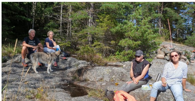
Paus vid jättegrytorna.

Lördag den 24 augusti avgick en vandring till jättegrytorna på Malmaön med 9 deltagare plus en siberian husky. Ett intressant utflyktsmål i en lagom äventyrlig terräng, som vi hoppas kan upprepas årligen.