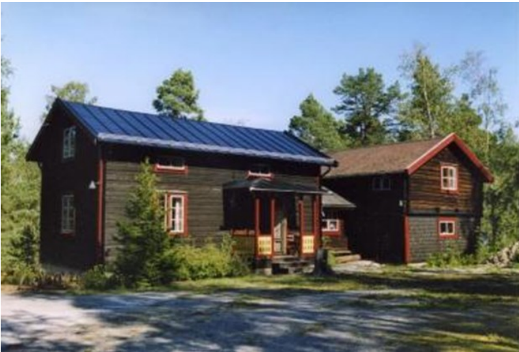
Stockstugan 2003.

Sigvard reste dit och tittade närmare på byggnaderna. Han bestämde sig, och priset blev 1 000 kronor för båda byggnaderna. Dessa monterades ner, och den 14 juni 1964 var det klart för transport till Strömme. Detta åtog sig hr Viberg, Nolsund, Hemmesta för en kostnad av 750 kronor.