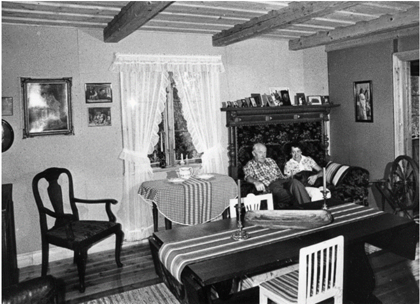
Sigvard med fru Doris i paneldivanen i stockstugan, nuvarande museet.