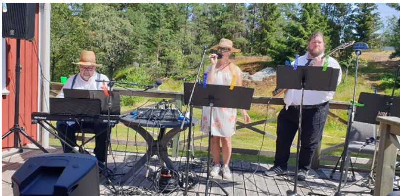
Bandet Kasum med familjen Hedenblad .

Strömmadagen 23 juni hölls en välbesökt friluftsgudstjänst av Värmdö församling på tunet vid Stockstugan. Därefter följde hembydsgårdsöppet med bejublade musikensemble.