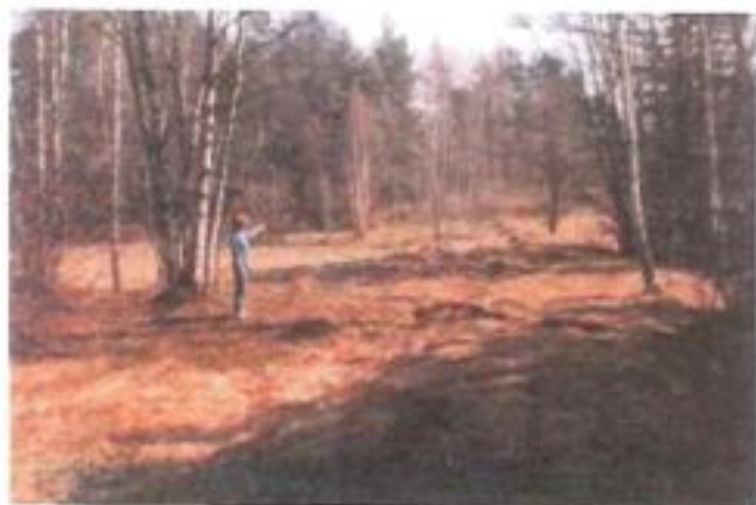
Sofia Ohlsson står på platsen där smedjan låg och pekar mot platsen där torpet låg. Till höger syns gamla Fagerdalavä- gen.. 1990.