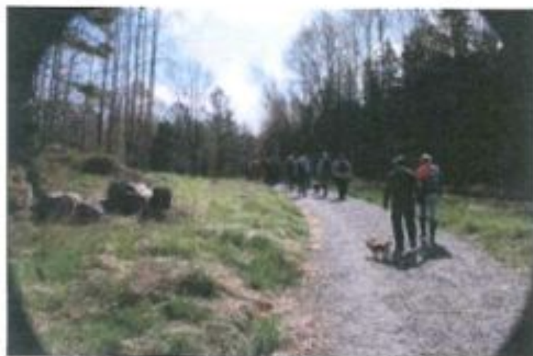
I backen till vänster låg torpet Pettersberg.

Den 23 maj 1885 gjorde jag mig gällande och kom till världen på en åker, där mor var ute och svedjade. Det var en bit ifrån stugan och barnaföderskan fick klara sig ensam. Det lyckades också utan hjälp av den vanliga "kära mor med Guds hjälp", som barnmorskan kallades. Ungen, som jag tills vidare fick heta, bar mor hem till stugan i sitt förkläde och där mötte far. Hon påstod att hon sagt "här har du nu, det är den tolfte", varmed smeden, som var rojalist, genmälde att då ska han också heta Karl. Jag blev