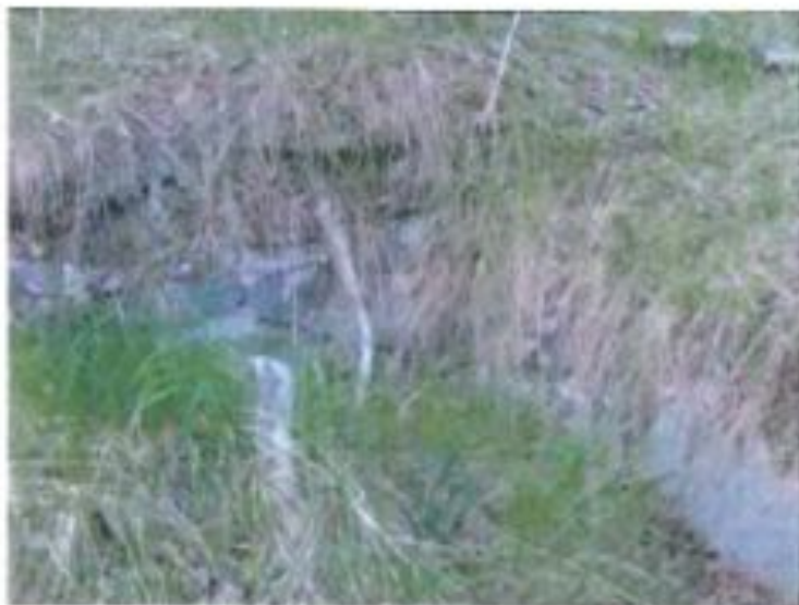
Rester av torpet Pettersberg 2008..

alltså Karl Otto Verner Ohlsson och hade nu säte och stäm- ma i vaggan..