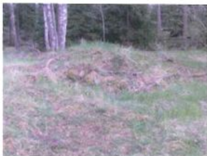
Resterna av smedjan 2008.