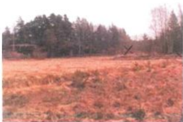
Vid vänstra krysset låg torpet, vid högra krysset låg smedjan.