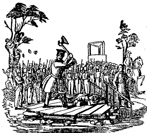
En avrättning med delinquenten liggande på stupstocken.

ännu vet vi inte med säkerhet var. Då alla letet färdigt efter resten av "bålet", var det härligt att få äta sin medhavda matsäck vi högsta punkten på Stegelberget. Sedan var det dags att vända tillbaka till bilarna efter en härlig utflykt.