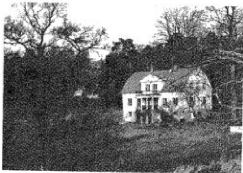
Didriksdal 1992. Huset byggdes 1926 då det gamla revs.