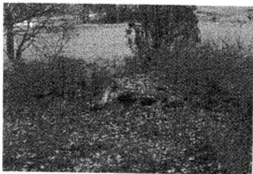
Foto taget från Södra Hesselmara mot korsningen Stavsnäsvägen - Tavastbodavägen