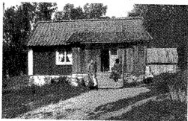
Rättarbostaden på Didriksdal slutet på 1800-talet