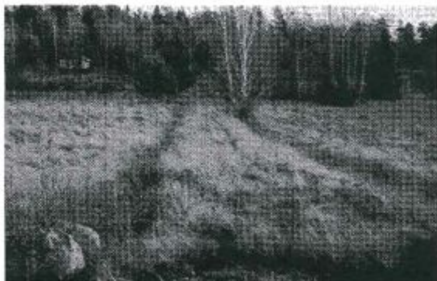
Den gamla vägen mot Norra Hesselmara.