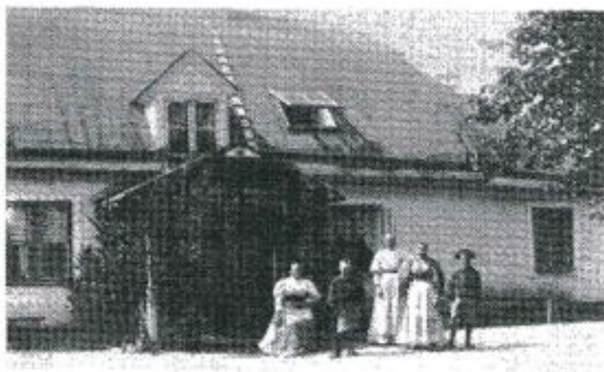
Mangårdsbyggnaden på Didriksdal 1895.