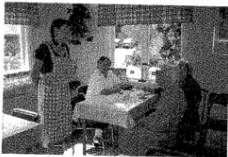
Lokalen som i sommar varit Café.