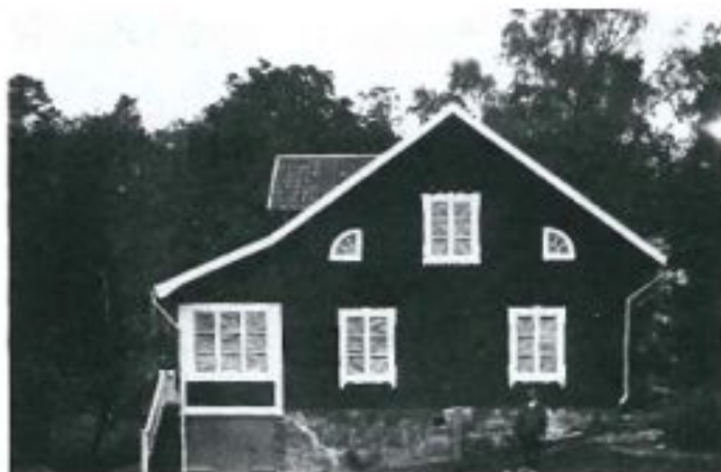
Mjölnargården omkring 1928.