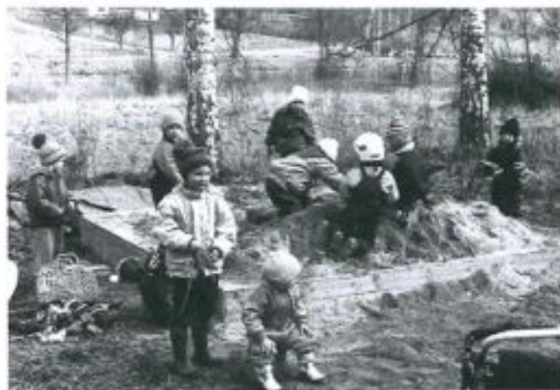
"Kom o Lek" på Kanaltomten.