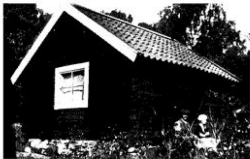
Gamla smedjan vid kvarnbacken ca.1930.

Värde 1.000 kronor. Samtliga byggnader i gott skick