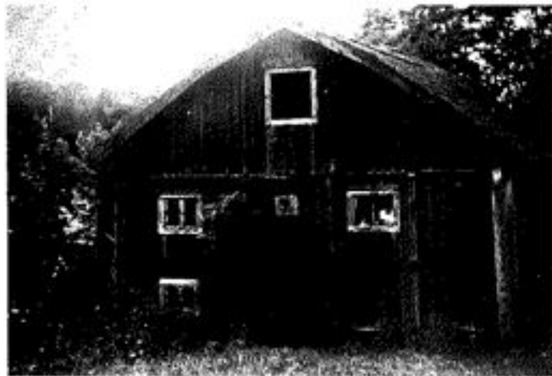
Malma Kvarn 1945.