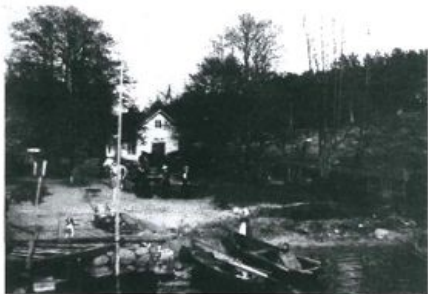
Strömman Diverseshandel 1895.