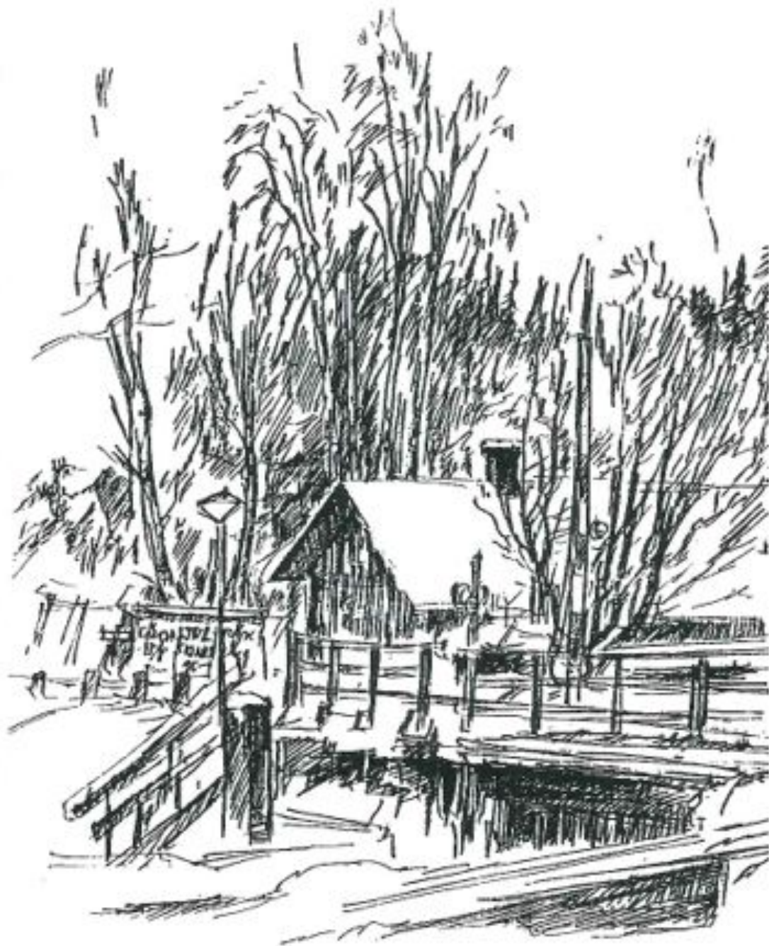
Omslagsteckning av Håkan Ljung / DN