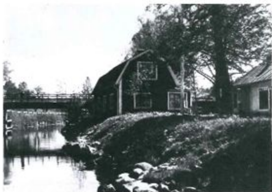
Kanalrtogan och affären 1952.