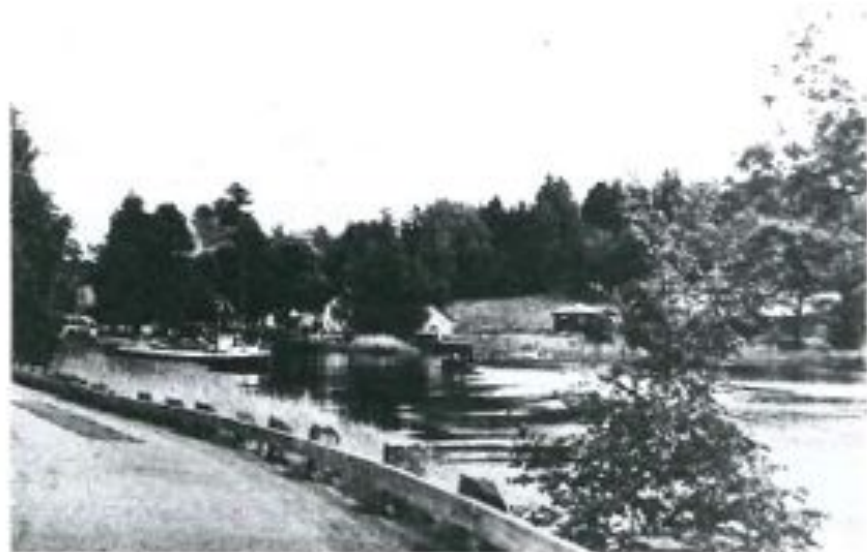
Vy över Stöckna med prinsessan Viola