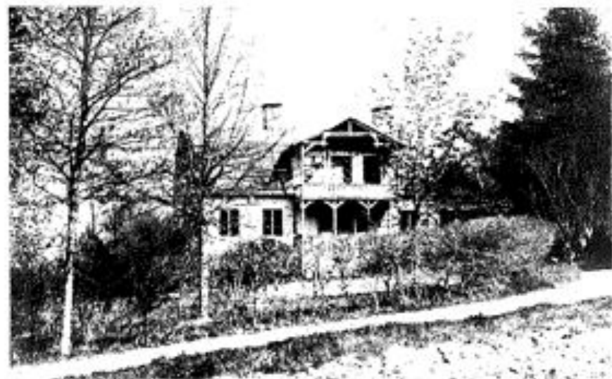
Pensionatet Marielund före sekelskiftet.