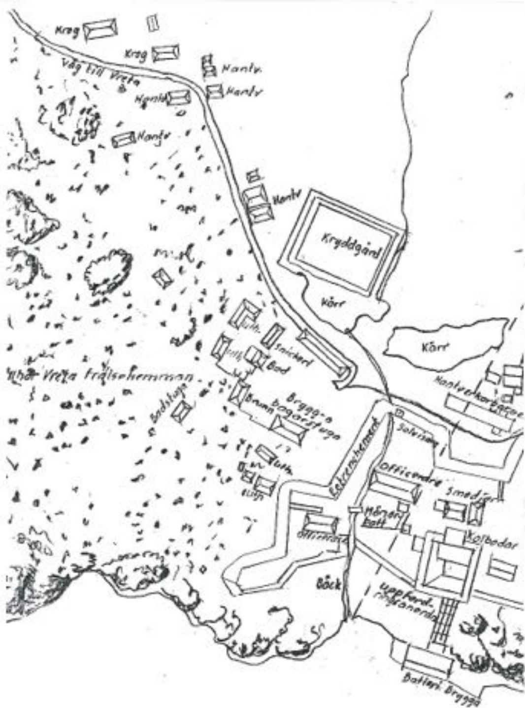
Avritning av: Situationsplan över Värmdö plateån vid Ordjupet 17