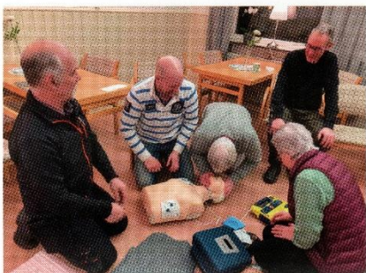
En grupp Arkhyttebor fick lära sig hjärt-lungräddning.