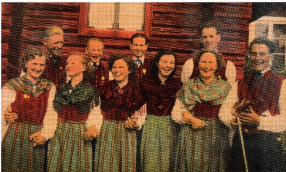
Folkdanslaget i vackra dräkter på 40-talet (handkolorerat foto)

Kontakta sockenkontoret på tel. 0225-405 22 eller mejl sockenkontoret.skedvi@telia.com om du kan hjälpa oss med något av ovan, eller/och om du vill vara med i vår studiecirkel.