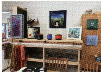
Konst i snickeriet på Lövåsens såg 2022