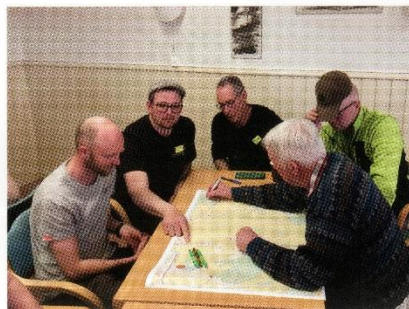
Kartläggning av resurser är viktigt för krisberedskap.