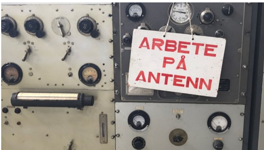
En av många spännande maskiner oå Grimeton.

Förutom stämmoförhandlingar, utdelning av diplom, fika och mingel hanns det även med hembygdsfest med utdelning av pris till Årets hembygdsförening och en hembygdsresa som bland annat besökte Världskulturarvet Grimeton. Allt mycket intressant och bra arrangerat!