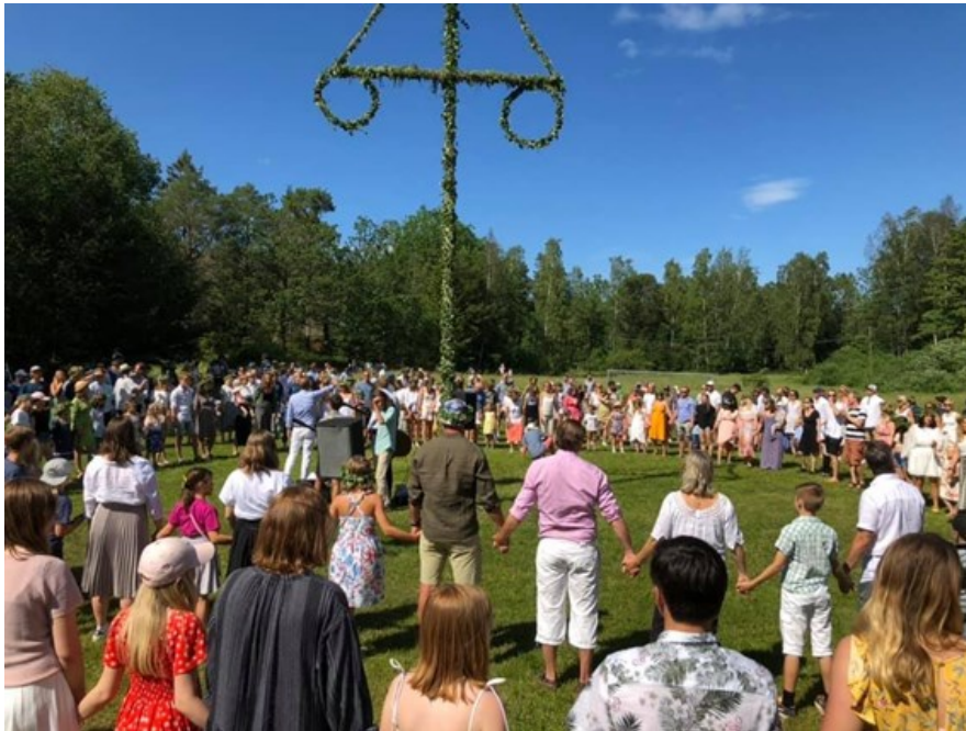
Midsommarfirande på Husarö.

till hembygdsföreningarna och hembygds museerna för att upptäcka det lokala kulturarvet och i annonsen länkar vi till kalendariet i hembygdsportalen.