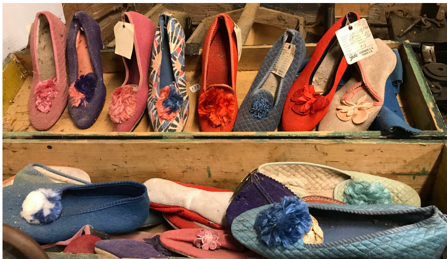
Toffelsamling på Färingsö Hembygdsförenings museum.

Kurserna var heldagskurser där fokus var att lära sig metoder för att städa och vårda hembygdsrörelsens kulturmiljöer. Moment som gick igenom var hur man förhindrar mögelväxt och hur man tar bort den när den uppkommer. Hur man får bukt med skadedjur som mal och pälsånger. Hur man minskar slitage från besökare och vid olika evenemang – allt från spill av mat och dryck till stearinfläckar. Kursdagarna innehöll bildvisning och föredrag, rundvandring på hembygdsgårdarna för att titta på städmetoder, förvaring, och förebyggande åtgärder. Tid för frågor och erfarenhetsutbyte fanns också och var mycket uppskattat. För att sprida denna viktiga kunskap vidare har förbundet sökt bidrag till kulturarvsarbete från Riksantikvarieämbetet för att spela in korta instruktionsfilmer om höst- och vårstädning, uthyrningar samt mögel och skadedjur. Vi har också lagt upp en särskild sida i hembygdsportalen med råd och tips om samlingsförvaltning.