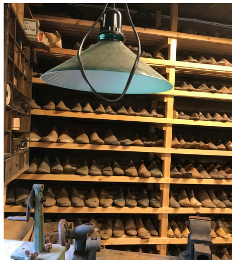
Skomakarsamling på Färingsö Hembygdsförenings museum.