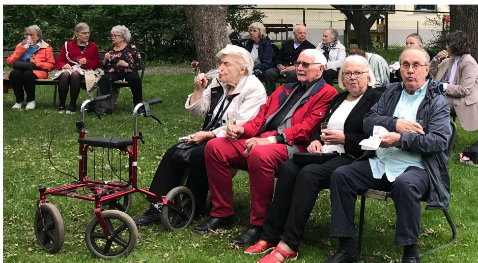
Solna Hembygdsförening firade 100-års jubileum i juni 2022.