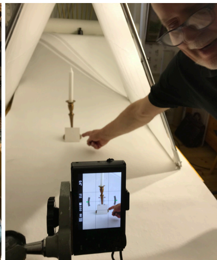
Kurs i föremålsfotografering hos Brännkyrka hembygdsförening.