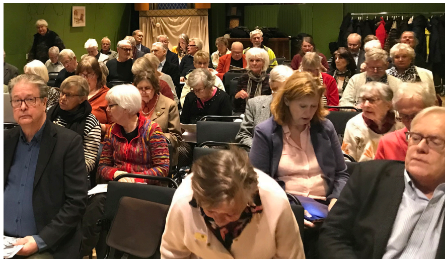
Årsmötesdeltagare på Medeltidsmuseet 2022.