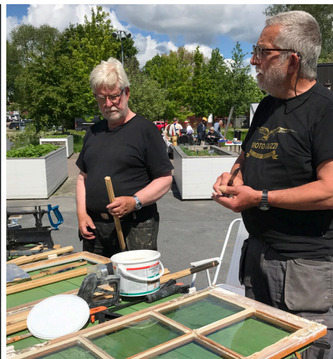
Fönsterhantverkare i Nyköping.