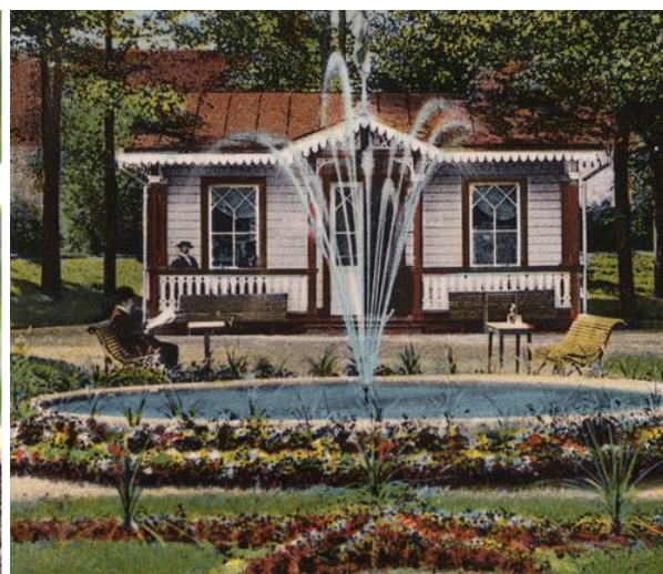
Bilder från Kulturväxtgruppens föredrag med Ulrika Flodin Furås