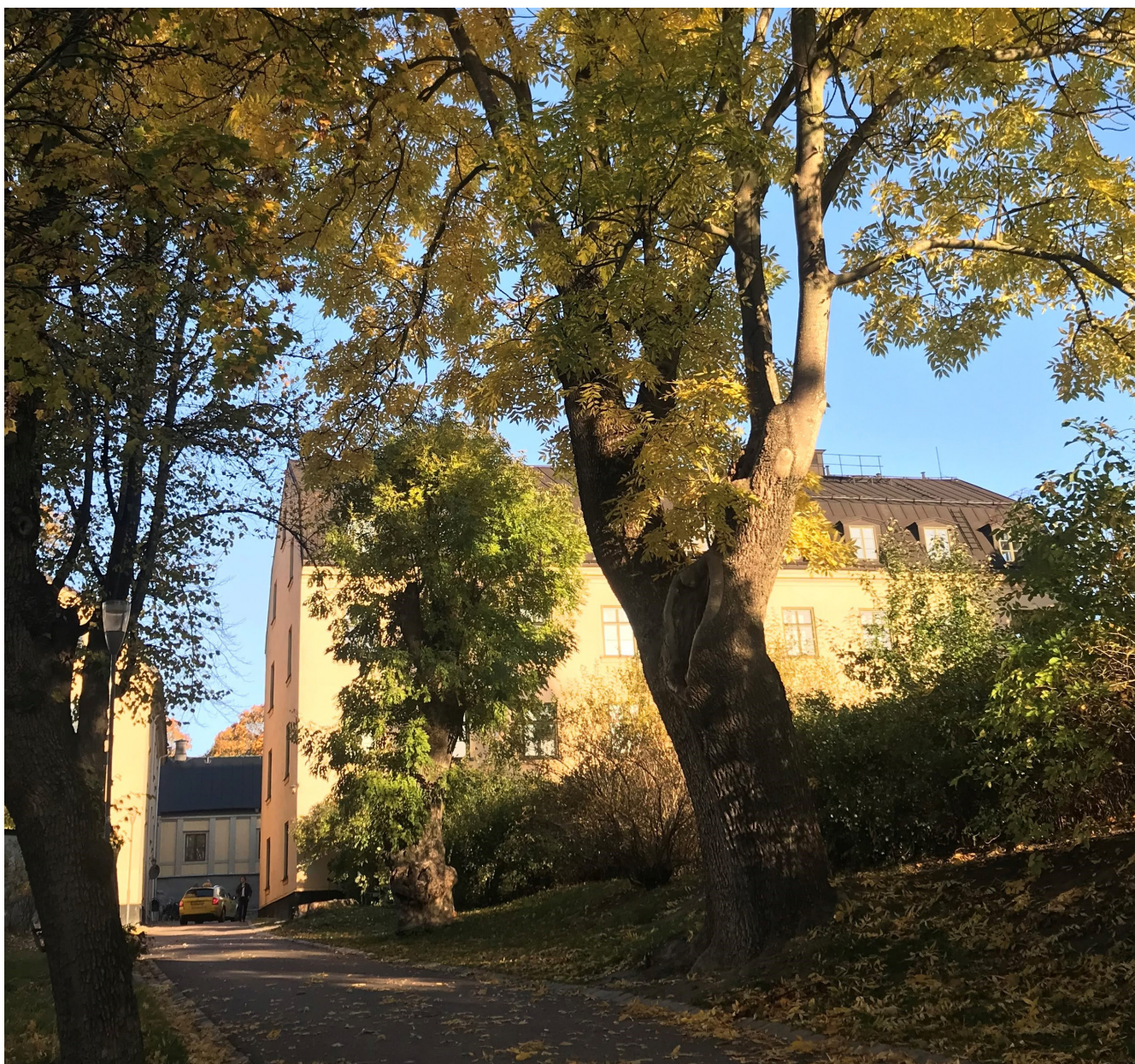
Stockholms läns hembygdsförbund i sommarskrud.

att överföra årets resultat 26 201 kronor i ny räkning