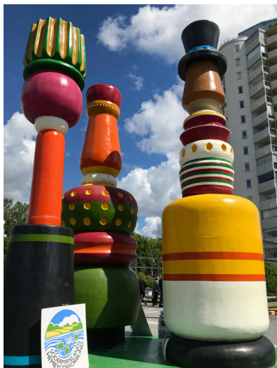
Bilder från Riksstämman i Nyköping 2022.

Förbundet gör sina prioriteringar, val av projekt och arbetsområden utifrån kontakten med medlemmarna. Vid träffar, samtal och möten lyssnar vi in hur föreningarna mår, vad som är på gång, vad man vill ha hjälp med och vart man är på väg med sin verksamhet. Vi försöker i möjligaste mån anpassa vår verksamhetsplanering så att den svarar mot medlemmarnas önskemål och behov, samtidigt som vi vill vara steget före för att kunna inspirera till utveckling. Under 2022 har följande frågor ansetts som särskilt viktiga: