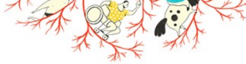
Illustration: Jennifer Nystedt.