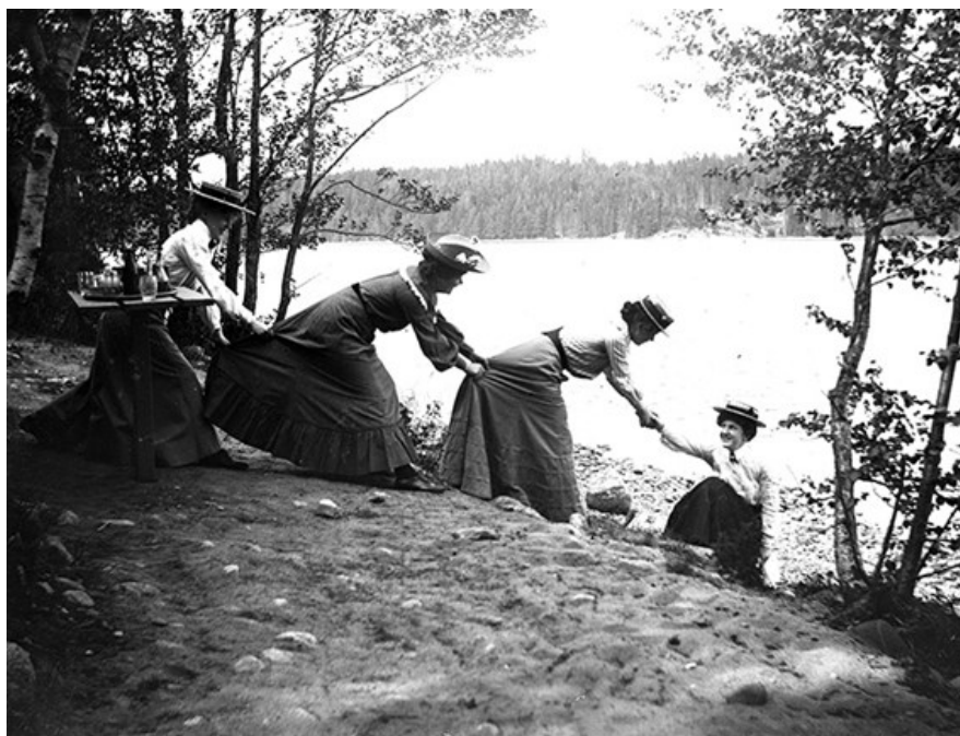
En bild från Kollektivt kulturarv: Flickor i långa kjolar vid Edsviken, nära Mörby. Fotot kan vara taget av Axel Pehrson. Troligen runt 1900. Danderyds hembygdsförening, cc-by.