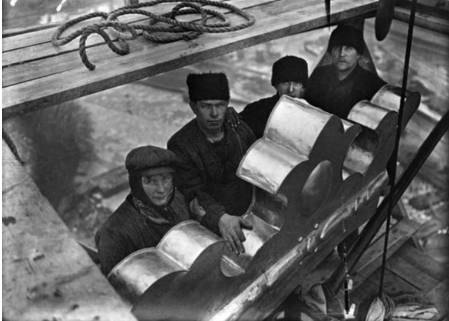
Grupp av arbetare vid monteringen av de tre kronorna på tornet. Okänd fotograf, 1920.